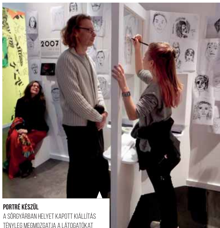
PORTRÉ KÉSZÜL A SÖRGYÁRBAN HELYET KAPOTT KIÁLLÍTÁS TÉNYLEG MEGMOZGATJA A LÁTOGATÓKAT

résben szintén sok a külföldről érkezett, magas a munkanélküliség, de a Lille-i Egyetem jogi karának köszönhetően magas a diákok aránya is. A Brasserie des Trois Moulins (Három Malom) sörfőzde a 18. században kezdte meg működését, és az 1930-as évekig működött. Az átalakítás után a kiállító- és előadóterek mellett egy FabLab, vagyis gyártási laboratórium is helyett kapott az épületben. A rejtélyes elnevezés egy nyitott innovációs műhelyt takar, ahol tagdíj ellenében bárki hozzáférhet a legmodernebb digitális gyártástechnológiákhoz, és 3D nyomtatók vagy lézervágók segítségével valósíthatja meg ötleteit.