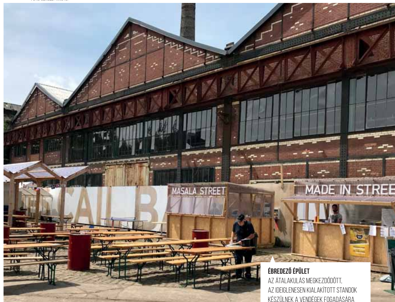
ÉBREDEZŐ ÉPÜLET AZ ÁTALAKULÁS MEGKEZDŐDÖTT, AZ IDEIGLENESEN KIALAKÍTOTT STANDOK KÉSZÜLNEK A VENDÉGEK FOGADÁSÁRA