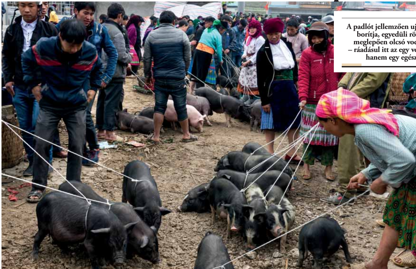
FOTÓ: VIETNAM