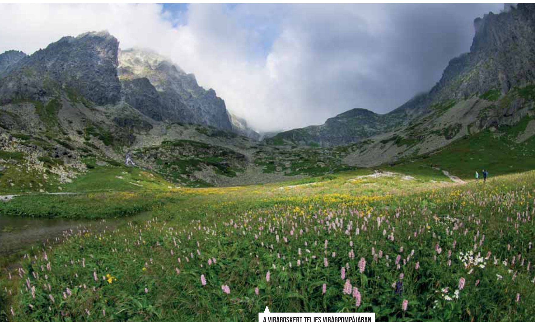
▲ A VIRÁGOSKERT TELJES VIRÁGPOMPÁJÁBAN