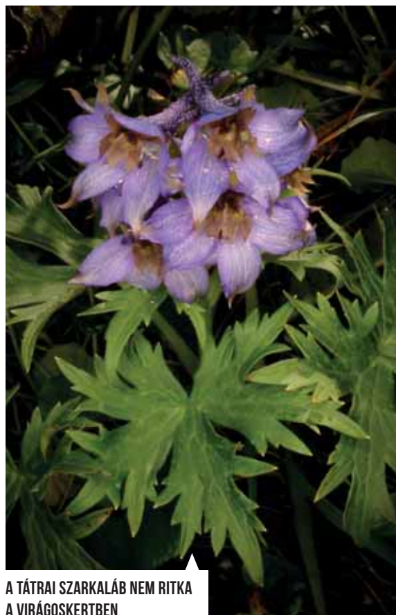
A TÁTRAI SZARKALÁB NEM RITKA A VIRÁGSKERTBEN