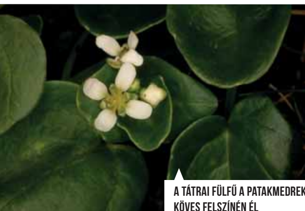
A TÁTRAI FÜLFŰ A PATAKMEDREK KÖVES FELSZÍNÉN ÉL