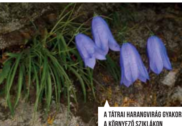
A TÁTRAI HARANGVIRÁG GYAKORI A KÖRNYEZŐ SZIKLÁKON