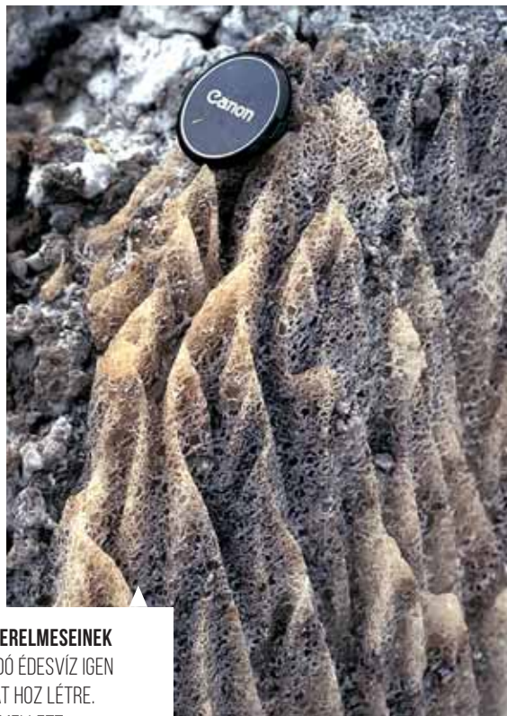
A GEOMORFOLÓGIA SZERELMESEINEK A KŐSÓT KÖNNYEN OLDÓ ÉDES-VÍZ IGEN LÁTVÁNYOS FORMÁKAT HOZ LÉTRE. A SZAKADÉKDOLINÁK MELLETT KARRBARÁZDÁS MIKROFORMÁK IS KIALAKULNAK