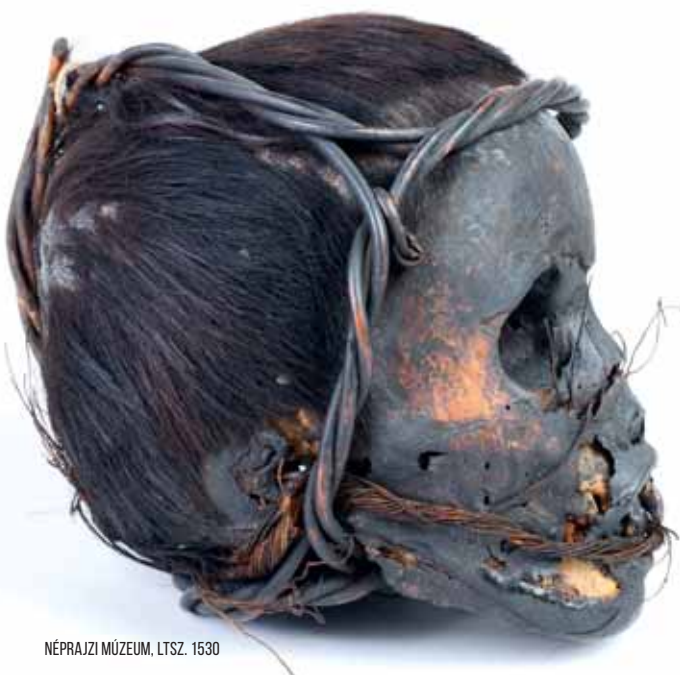
NÉPRAJZI MÚZEUM, LTSZ. 1530

XÁNTUS EGYIK SARAWAKBÓL HAZAKÜLDENDŐ, TÖRÉKENY TÁRGYAKAT TARTALMAZÓ LÁDÁJA HÁTIKOSARAT VISELŐ, BENNSZÜLÖTT NŐKKEL