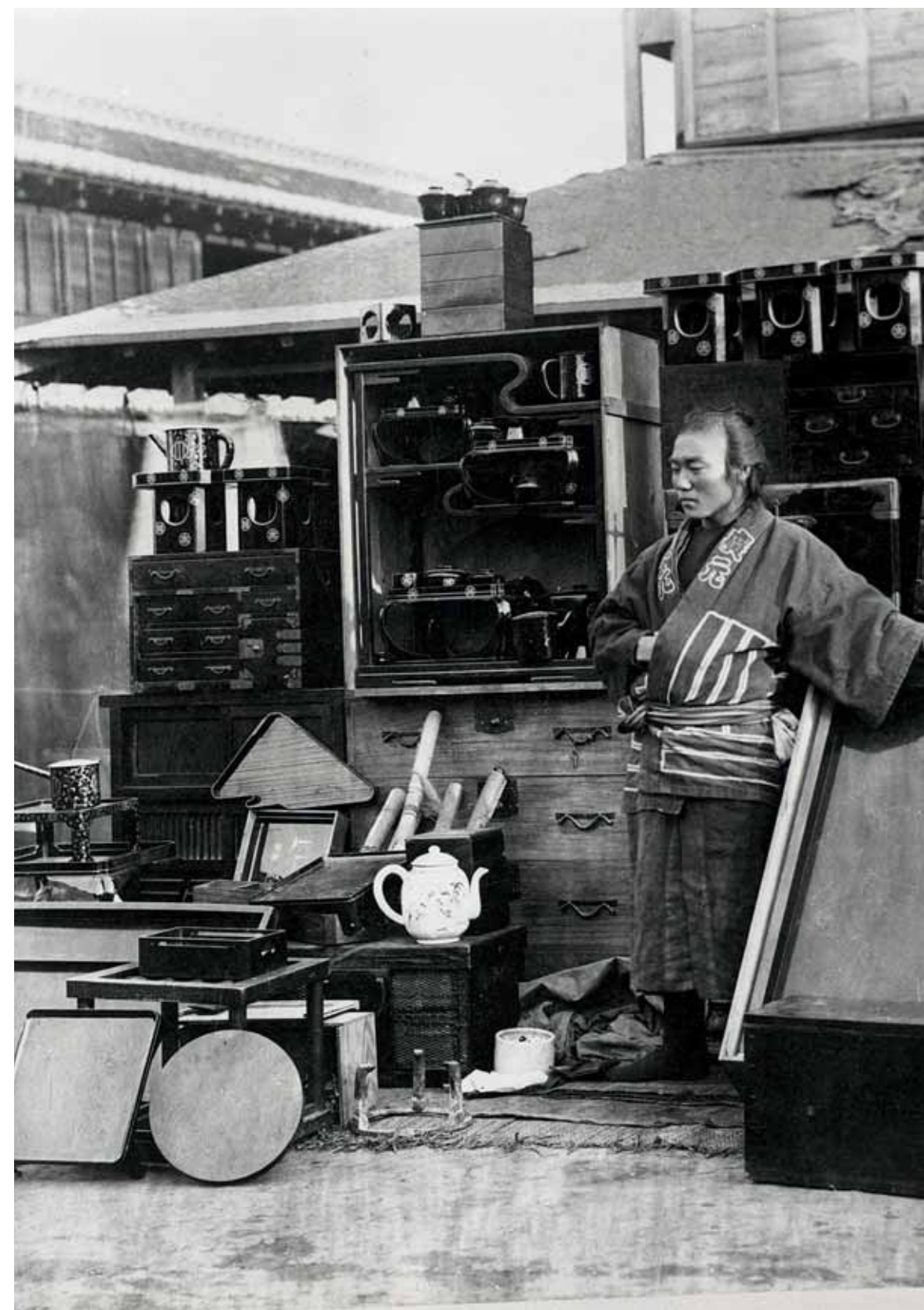
NÉPRAJZI MÚZEUM, LTSZ. F15018

KÜLFÖLDI MŰGYŰJTŐK SZÁMÁRA ÜZEMELŐ DÍSZMŰÁRU-KERESKEDÉS JOKOHAMÁBAN XÁNTUS VÁSÁROLTA FÉNYKÉPFELVÉTEL