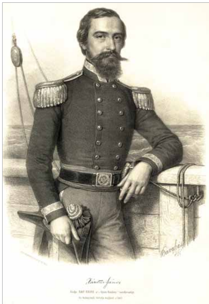
XÁNTUS JÁNOS (1825–1894)