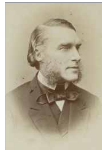
KARL RITTER VON SCHERZER (1821–1903)

tületének alkalmazásában átkerült a Kaliforniai-félszigeten található Szent Lukács-fokra. Az Amerikában végzett természettudományos gyűjtőmunkái közül ez bizonyult a legértékesebbnek. Az általa felfedezett 390 faj közül 290 erről a területről való, közülük pedig csaknem 50 viseli Xántus nevét.