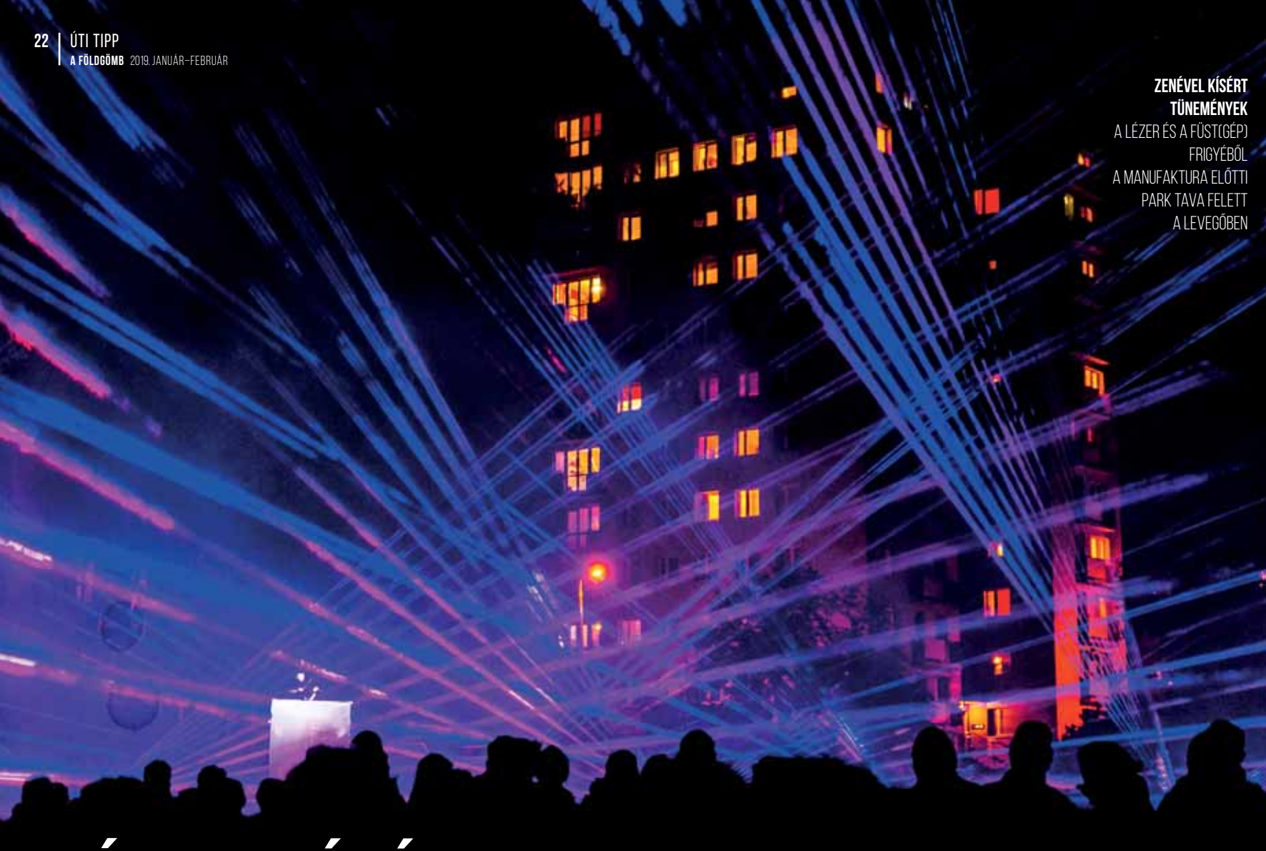
ZENÉVEL KÍSÉRT TÜNEMÉNYEK A LÉZER ÉS A FÜST(GÉP) FRIGYÉBŐL A MANUFAKTURA ELŐTTI PARK TAVA FELETT A LEVEGŐBEN