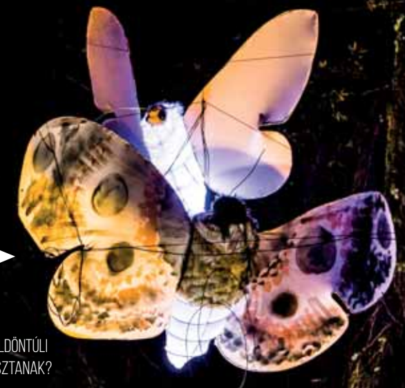
FÉNYPILLANGÓK A MANUFAKTURA PARKJÁBAN EGY FA ÁGÁN MESEBELI VAGY FÖLDÖNTÜLI HANGULATOT ÁRASZTANAK?

A mai Szabadság és a Függetlenség tér között elnyúló Pietrowska több tekintetben is birtokolja a „leg”-et. Itt már 1835-ben felhúzták az első téglapületeket, 1869-től már gázvilágítás működött, és 1876-tól sétálnak kőburkolaton a járókelők, majd 1898-ban az első villamos is