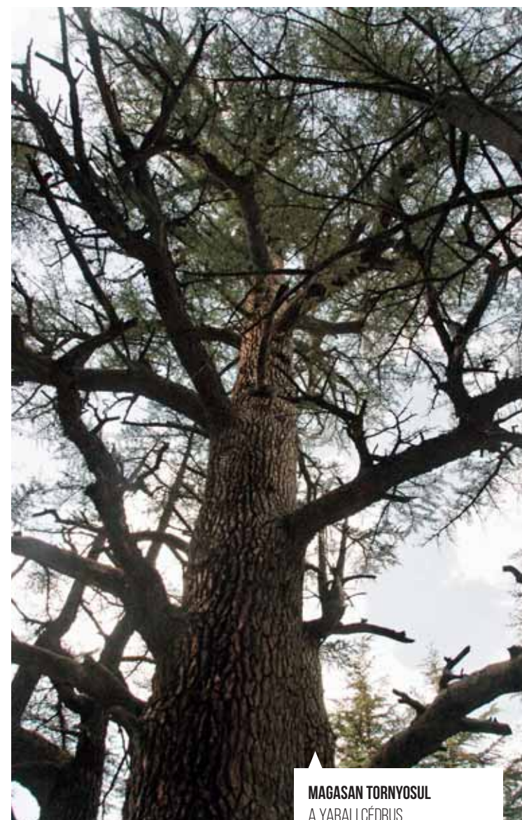
MAGASAN TORNYOSUL A YARALI CÉDRUS