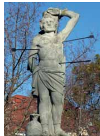
TOLNA SZENT VÁROS,

Ha egyáltalán... „Itt minden utcában más náció lakott. 200 évvel a betelepülés után is számon tartották, ki honnan érkezett. Persze ekkor már inkább a foglalkozás volt a döntő, a jobb szakmákba nem engedtek be idegeneket” – mesélik a könyvtárban, ahol nagy becsben tartják a monográfiát, de korántsem hiszik, hogy mindent tud Tolnáról.