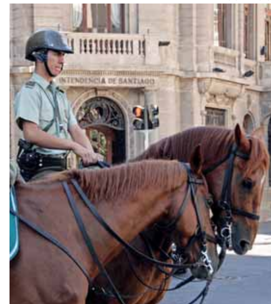
FOTÓ: HEILING ZSOLT