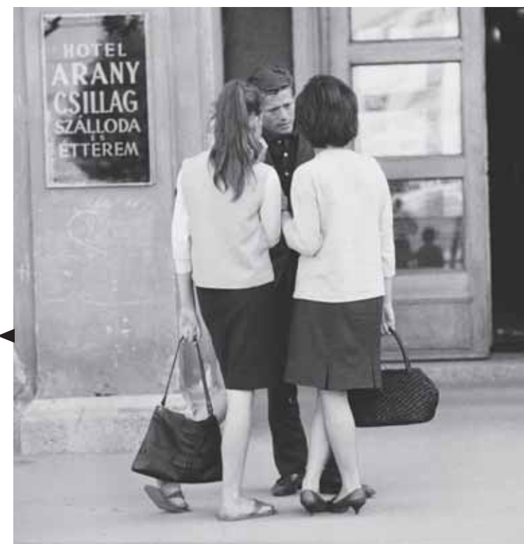
1962