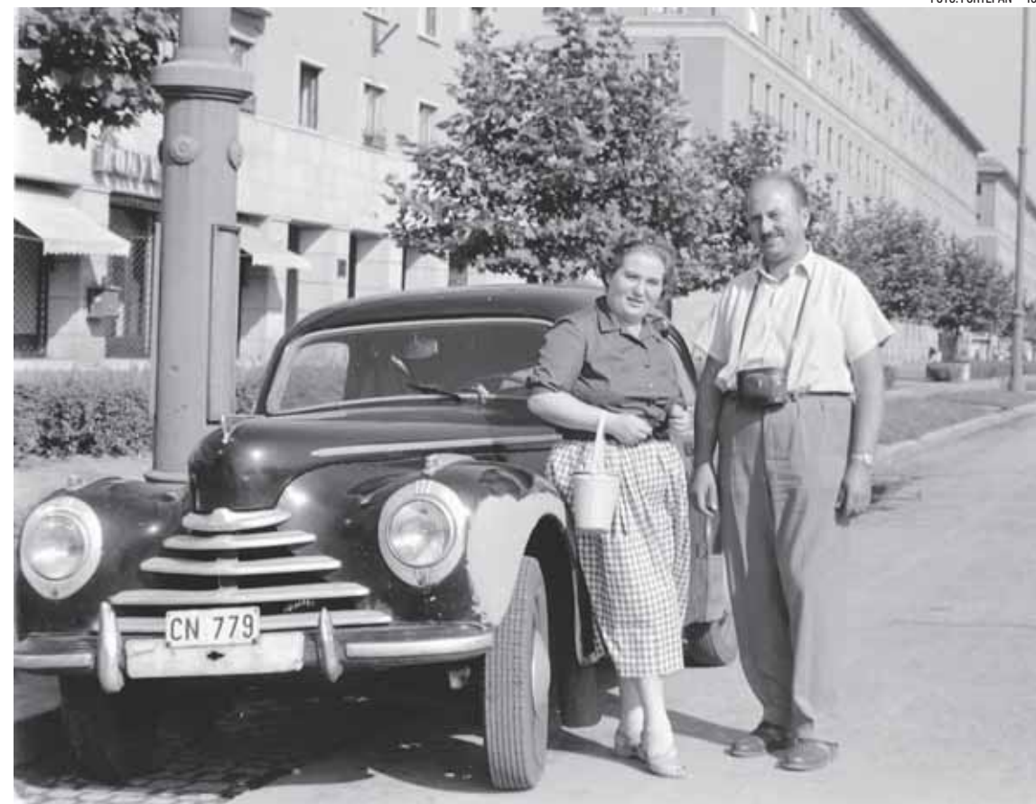
FOTÓ: FORTEPAN – 1952

város ellen, mely akkor nemcsak egy várost, hanem általában a „félresiklott szocializmust” is jelentette. Szij Rezső művelődéstörténéssz 1967-es „jegyzeteiben” ténylegesen vádiratot szerkesztett: „Soha el nem tüntethető ellentmondások keletkeztek az új városban, a tervezés bizonytalansága, kapkodása, egyszóval koncepciótlansága miatt.”