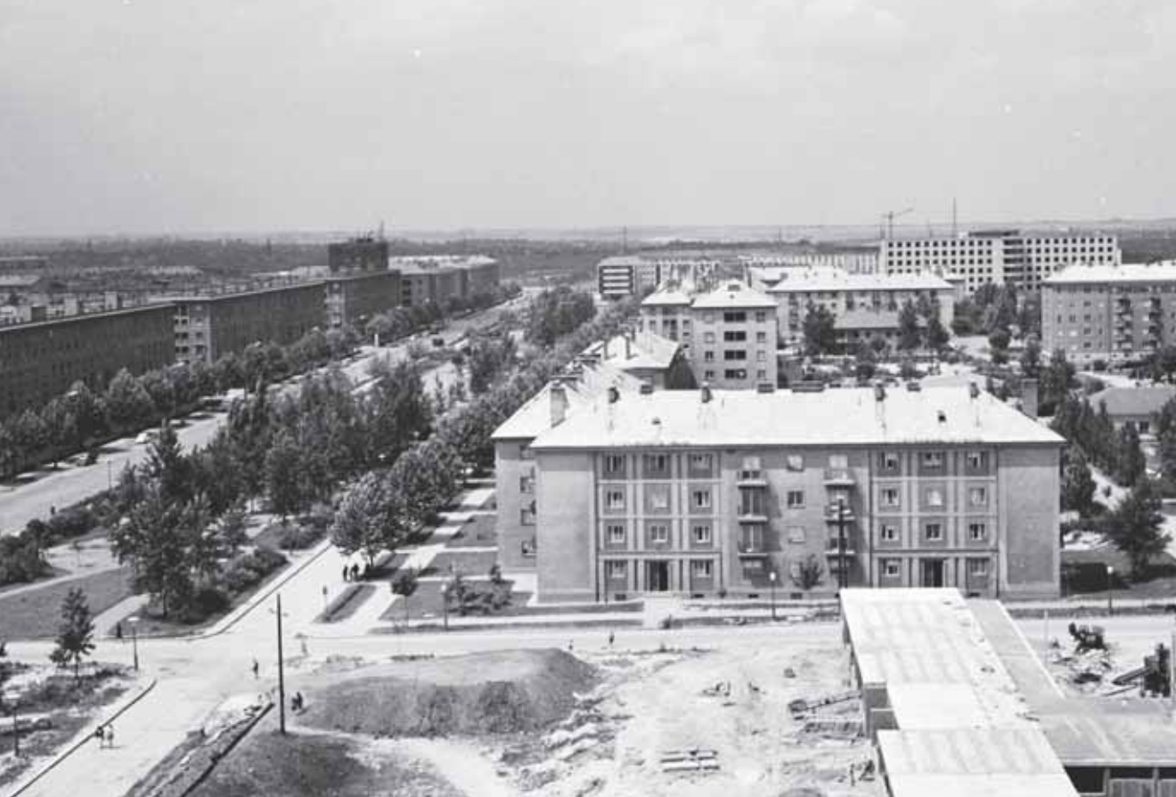
FOTÓ: FORTEPAN (LECHNER DOKUMENTÁCIÓS KÖZPONT) – 1962