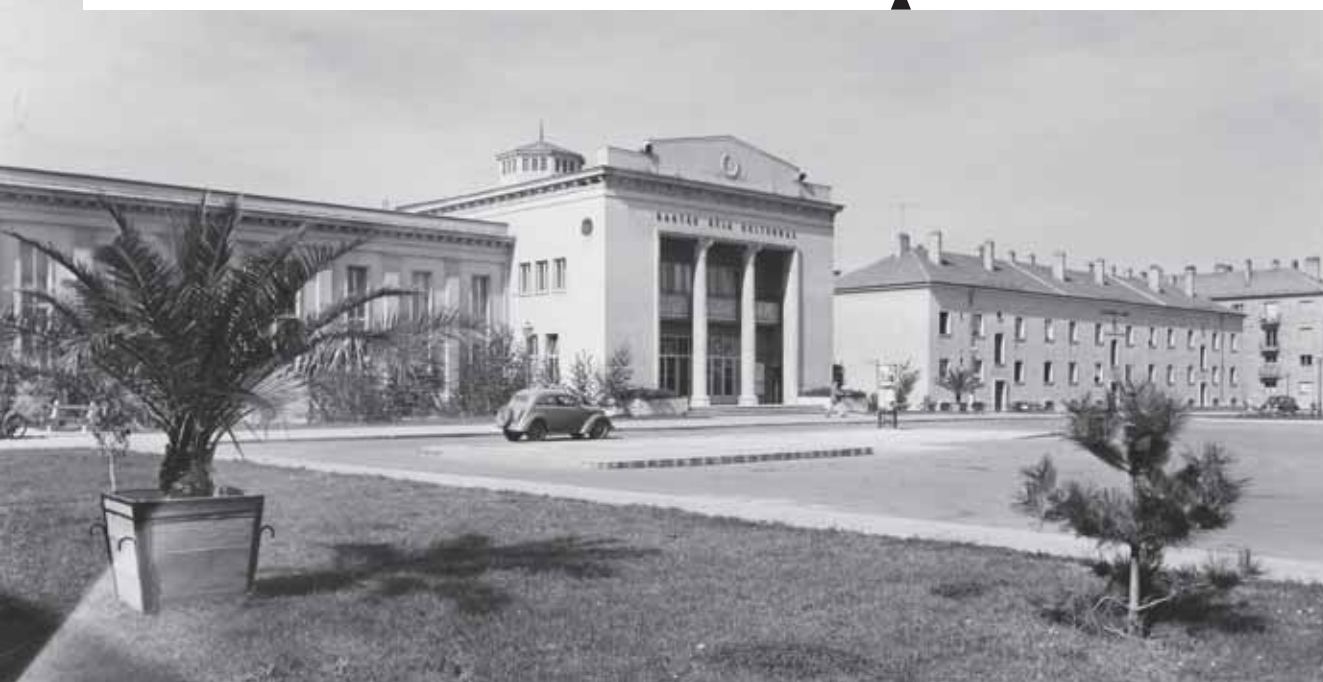
1956