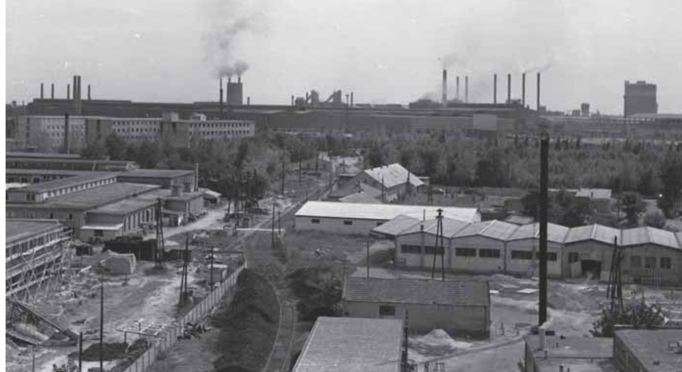
FOTÓ: FORTEPAN (LECHNER DOKUMENTÁCIÓS KÖZPONT) – 1965