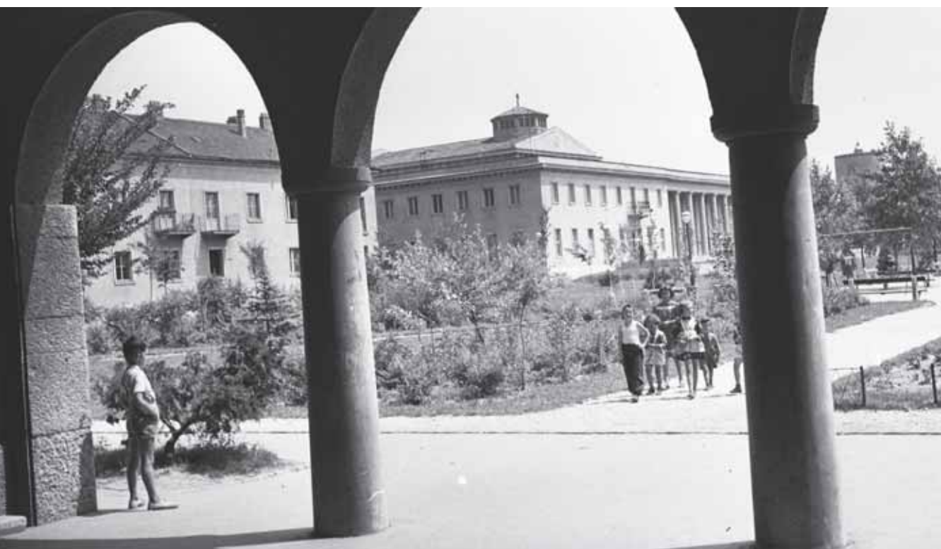
1962