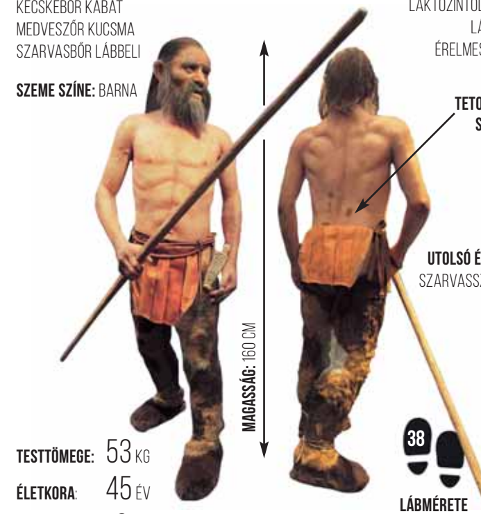
GRAFIKA: SCHIMPER