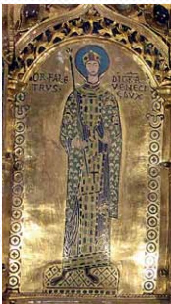
ORDELAFO FALIERO DÓZSE ALAKJA A VELENCEI SZENT MÁRK- KATEDRÁLIS PALA D'ORO OLTÁRÁN. ZÁRA FALAINÁL, A MAGYAROKKAL VÍVOTT CSATÁBAN ESETT EL

KORÁBBI MŰSORAINK MEGHALLGATHATÓK: WWW.TRENDFM.HU