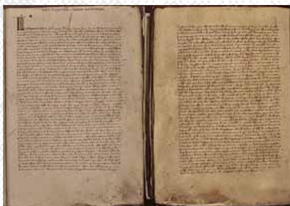
ÉVTIZEDEKRE BIZTOSÍTOTTA A DALMÁCIA FELETTI MAGYAR URALMAT AZ ZÁRAI BÉKESZERZŐDÉS SZENT FERENC-TEPLOMBAN ŐRZÖTT MÁSOLATA