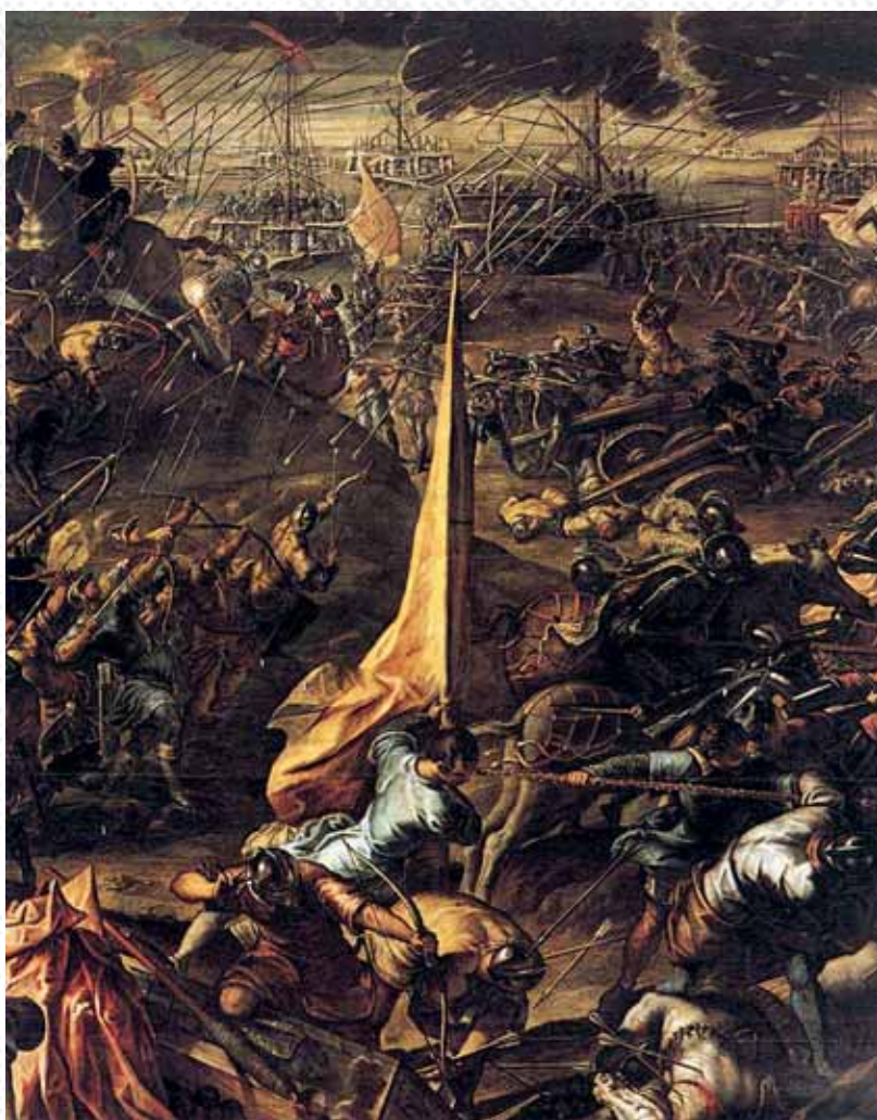
J. TINTORETTO: „ZÁRA OSTROMA” C. FESTMÉNYÉNEK RÉSZLETE A DÓZSEPALOTA SZAVAZÓTERMÉBŐL. 1202-BEN VELENCENEK CSAK A KERESZTES HAD SEGÍTSÉGÉVEL SIKERÜLT BEVENNIE A VÁROST

85 évvel később Zára ismét sorsdöntő magyar–velencei ütközet színhelye volt. A már 1167-től III. István, majd öccse, III. Béla magyar királyok uralma alá került Dalmáciát és annak legnagyobb városát, Zárát egészen 1202-ig hiába próbálták a velenceiek visszahódítani. Ám az akkor megindult negyedik kereszties hadjárat során a Szentföldre tartó 10 000 keresztény zsoldos támogatásával Velencének sikerült bevennie a tengerparti erősséget. A Köztársaság