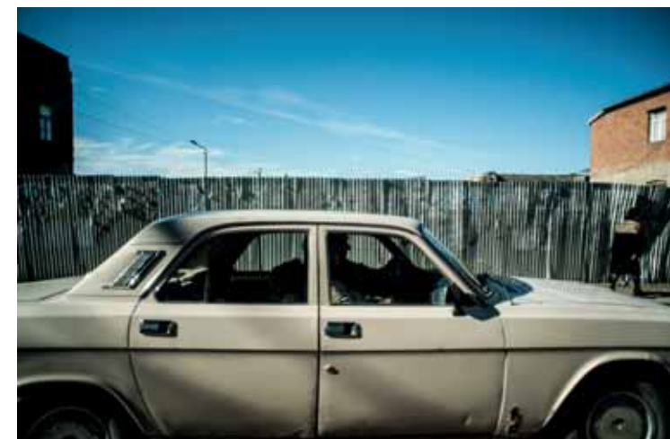
ZÚG A VOLGA TALÁN SOSEM FOGYNAK EL, HISZ ANNYIAN VANNAK, AKÁR AZ...

Grúzia esete viszont mindenképpen különleges. Bár az orosz kisebbség aránya itt mindig is alacsony volt, az abház és oszét nemzetségek függetlenségi törekvéseinek fegyveres támogatásával, a szakadár Abházia és Dél-Oszétia mint kváziállamok létrehozásával 2008-ban Grúzia Nyugat felé vezető útját is sikerült blokkolni. Az orosz katonaság pedig mint „békefenntartó erő” jelen van mindkét szakadár államban.