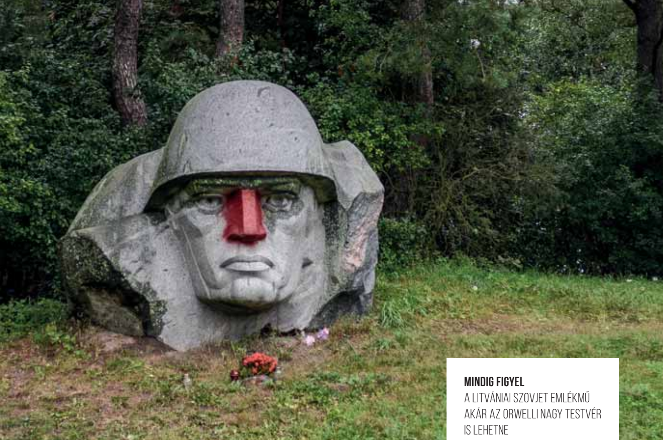
MINDIG FIGYEL A LITVÁNIAI SZOVJET EMLÉKMŰ AKÁR AZ ORWELLI NAGY TESTVÉR IS LEHETNE