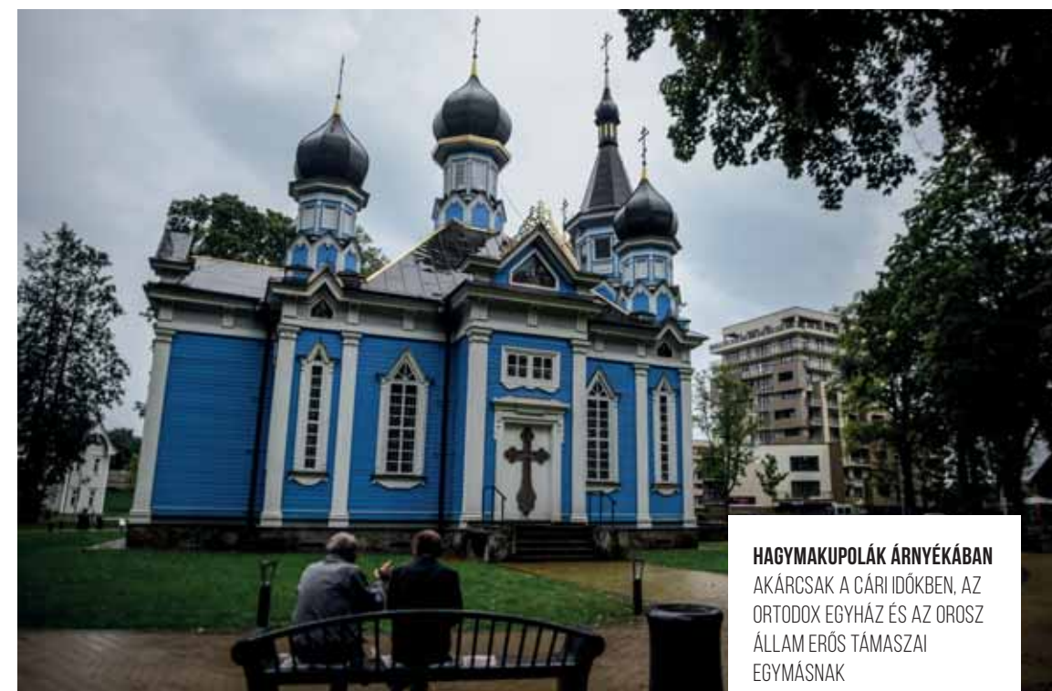
HAGYMAKUPOLÁK ÁRNYÉKÁBAN AKÁRCSAK A CÁRI IDŐKBEN. AZ ORTODOX EGYHÁZ ÉS AZ OROSZ ÁLLAM ERŐS TÁMASZAI EGYMÁSNAK