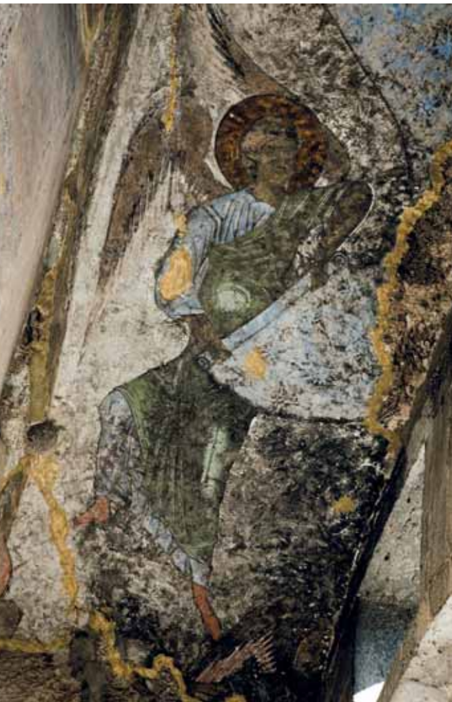
REJTVE, MEGŐRIZVE Vardzia ezeréves freskói

Az üledékes kőzet, ami az itteni hegyeket felépíti, néhány méterenként eltérő keménységű egységekből áll, így az elfolyó csapadék a puhább szinteket kimosza, természetes barlangokat vájva a kőzetbe. Az üregeket később az ide települő szerzetesek vették birtokba, kibővítették, elfalazták a külvilágtól, és belső folyosókkal kötötték össze azokat; kápolnákat, templomokat, raktárakat alakítottak ki a hegy gyomrában. De nemcsak egyházi személyek laktak itt: voltak világiak is, a hely valaha igencsak népes volt.