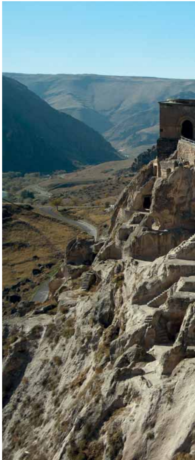
FARAGOTT KÖVEK – A KÖZÉPKOR Vardzia néha egy kicsit mintha Völgyzugoly bejárata lenne: fenséges és romantikus is egyben