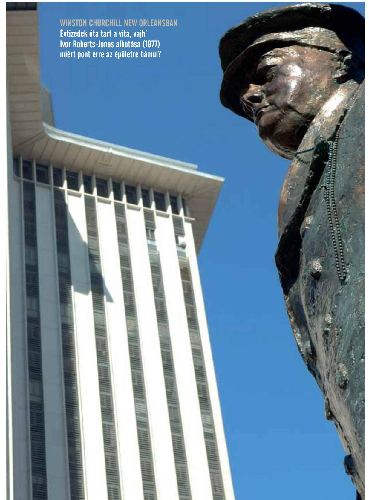
WINSTON CHURCHILL NEW ORLEANSBAN Évtizedek óta tart a vita, vajh' Ivor Roberts-Jones alkotása (1977) miért pont erre az épületre bámul?