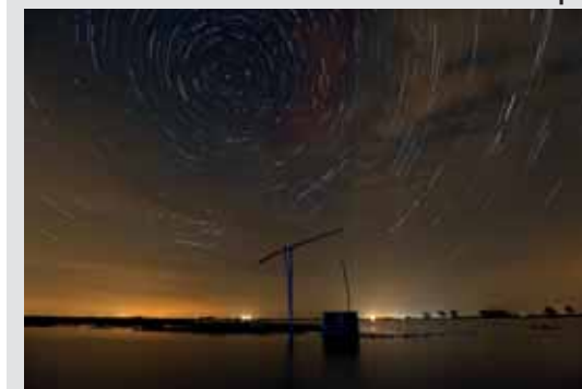
FOTÓ: SZILÁGYI ATTILA