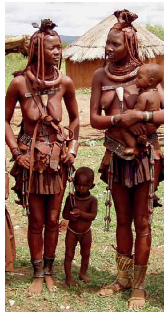
HIMBA ASSZONYOK Kifejezetten szavannai vándorlásra termettek – de fotózásuk egyre inkább turistacélpont

A falvak népe túlnyomó részben az Afrika középső részeiből betelepült bantu csoportokhoz tartozik. Évszázadokkal ezelőtt kezdődött délre vándorlásuk során majdnem egész Dél-Afrikát meghódították, s mivel ma már egyértelműen többségben vannak, ők is vezetik az itteni államokat. Az őslakosok többnyire kiszorultak a jóból, és ez az ország 1990-es függetlenné válása előtti, Angolát, Namíbiát és részben Dél-Afrikát is érintő háborús helyzetben is visszaköszönt. A szavannát jól ismerő, a bozótos-ligetes területeken kiválóan har-