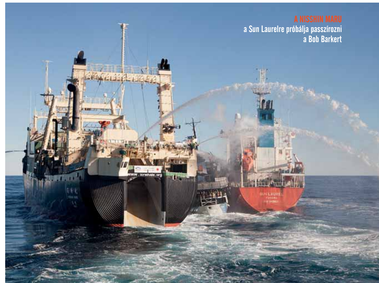
A NISSHIN MARU a Sun Laureltre próbálja passzírozni a Bob Barkert