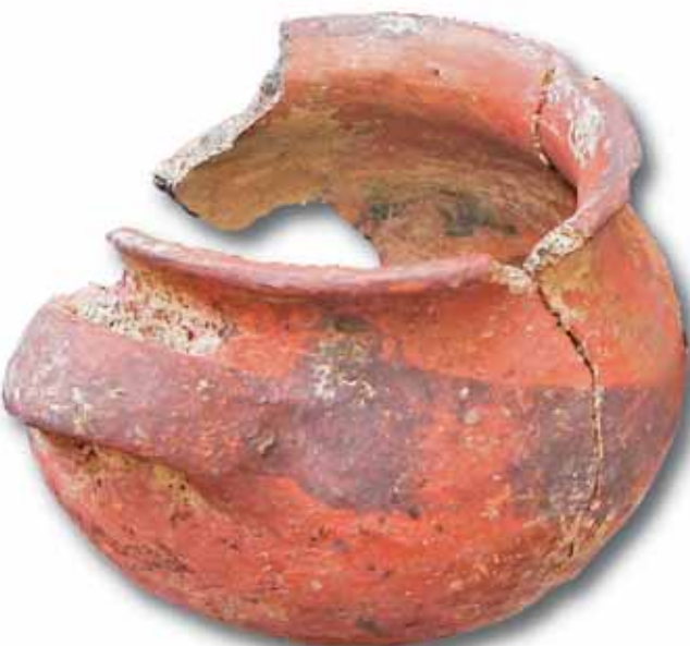
FESTÉSSEL DÍSZÍTETT FAZÉK

soknak „... minden városban és tambóban (köztük Pariában)... mint az inka katonáinak, ételmezt és inivalót és charquit (szárított lámahús) és sarukat, ruhákat és nagy mennyiségű quinoa lisztet és lámákat és asszonyokat adtak...”