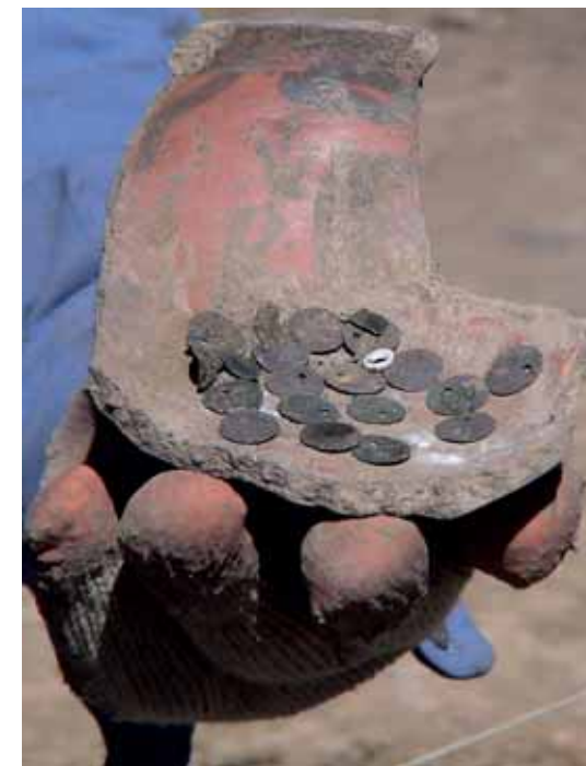
RUHADÍSZÍTÓ KORONGOK: bronz, ezüst és csont

Az inka kori Paria valószínűleg 1546-ban jutott utoljára szerephez, amikor a koronával szemben lázadó konkvisztádorok és a királpárti erők néztek ott farkasszemet egymással. Ezt követően már csak egy 1593-ban másolt dokumentumban bukkan fel, immár Paria la vieja (Ó-Paria) néven, ami arra utal, hogy az Inka Birodalom által létesített központot valamikor 1546 és e dokumentum keletkezése között költöztették át mai helyére, s maradt rejtve több mint négy évszázadon át. ☺