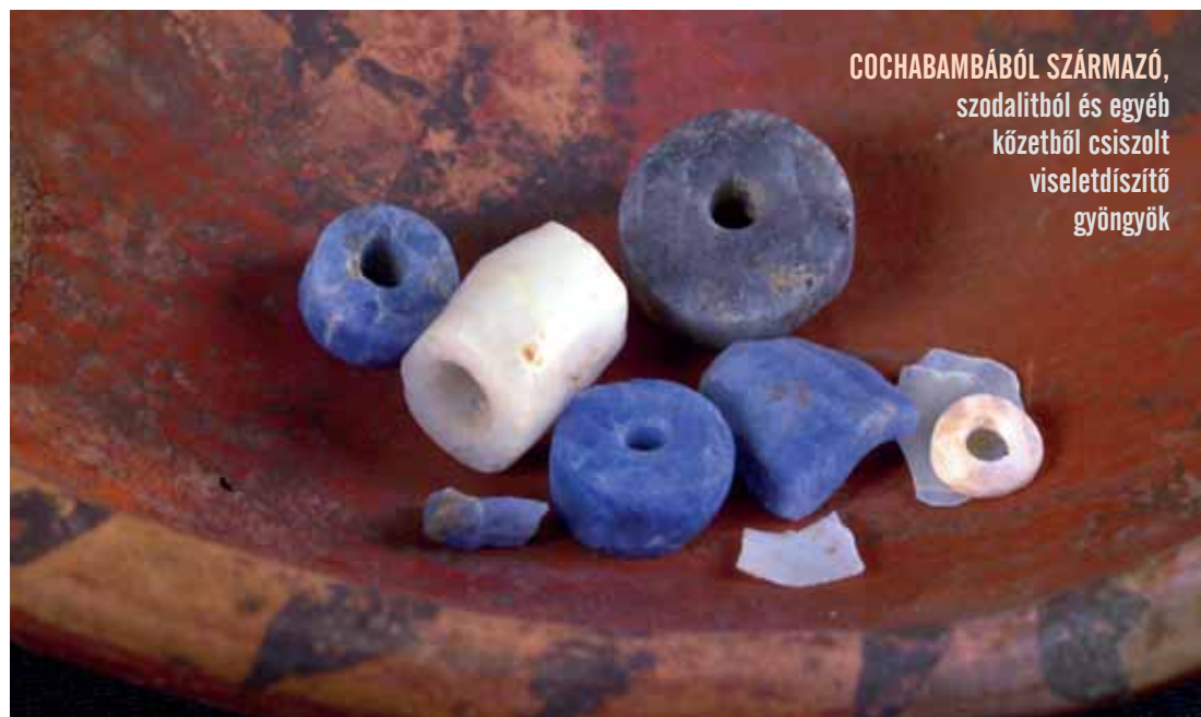
COCHABAMBÁBÓL SZÁRMAZÓ, szodalitból és egyéb kőzetből csiszolt viseletdíszítő gyöngyök