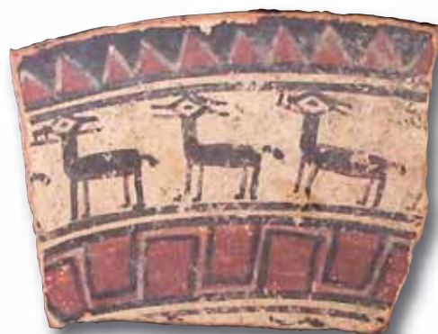
LÁMÁKKAL DÍSZÍTETT, ÚN. INKA BIRODALMI STÍLUSÚ TÁNYÉR TÖREDÉKE Az utóbbi idők anyagvizsgálatai, köztük az általunk végzetek is, kiderítették, hogy ezek is helyben készültek, feltehetően állami fazekastelepeken

Ennek magyarázatát talán abban kell keresnünk, hogy a 14. század folyamán egy cuzcoi főnökségből megszülető inka állam olyan környezetben jött létre, ahol a természeti erőforrások igen szegényesek (gyenge minőségű talaj, magas erózió, száraz éghajlat, fagyveszély, korlátozott öntözési lehetőségek), eloszlásuk egyenetlen, aminek következtében csak helyenként és korlátozottan alakulhat ki jelentősebb mezőgazdasági fölösleg és sűrűbb népesség. Ez pedig megakadályozta, hogy fejlett munkamegosztáson alapuló, foglalkozásonként specializált kézművesség, arra alapozva pedig fejlett csererendszer és városias településhálózat jöhessen létre.