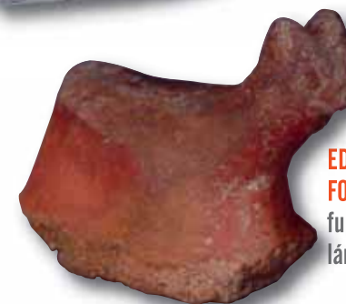
EDÉNYFEDŐ FOGÓJAKÉNT funkcionáló lámafigura