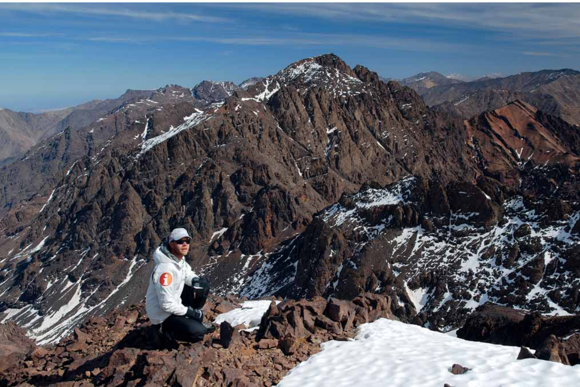
A JEBEL TOUBKAL (4167 m) TÖMBJE A RAS N'OUANOUKRIM CSÚCSÁRÓL Háttérben, északkelet felé a Magas-Atlasz távolabbi vonulatai húzódnak (balra)

Mégpedig igazi téli körülmények között, mert a közkeletű hiedelmekkel szemben az Atlaszban télen igazán tél van. Hideg, hó meg jég. Ez persze nem gátolja az apró, helyi margarétát abban, hogy egy nap-sütötte, védett sziklamélyedésben ilyenkor is kivirágozzék, de ez inkább kivétel, semmint szabály.