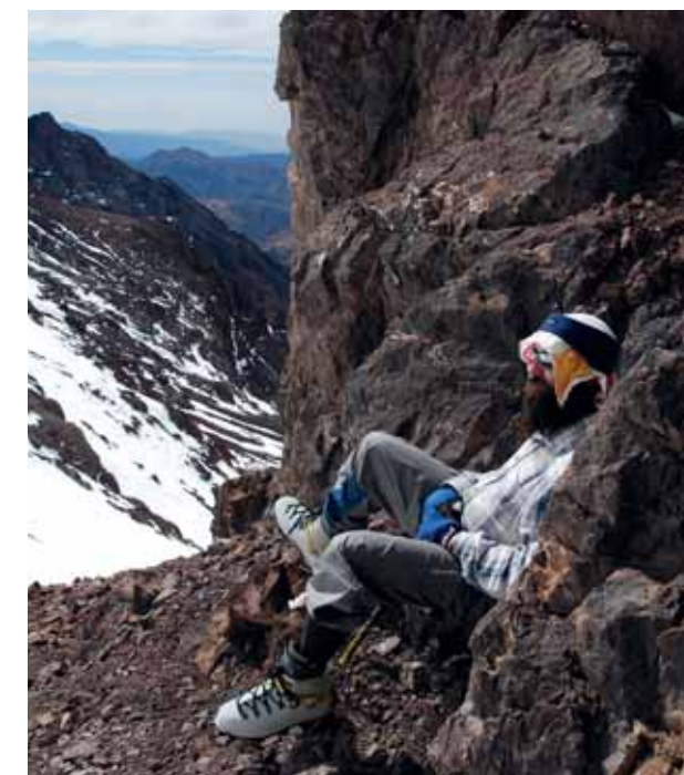
PIHENŐ A N'OUANOUKRIM-HÁGÓ (3750 m) fölötti gerinc egyik sziklatornjának tövében (jobbra)