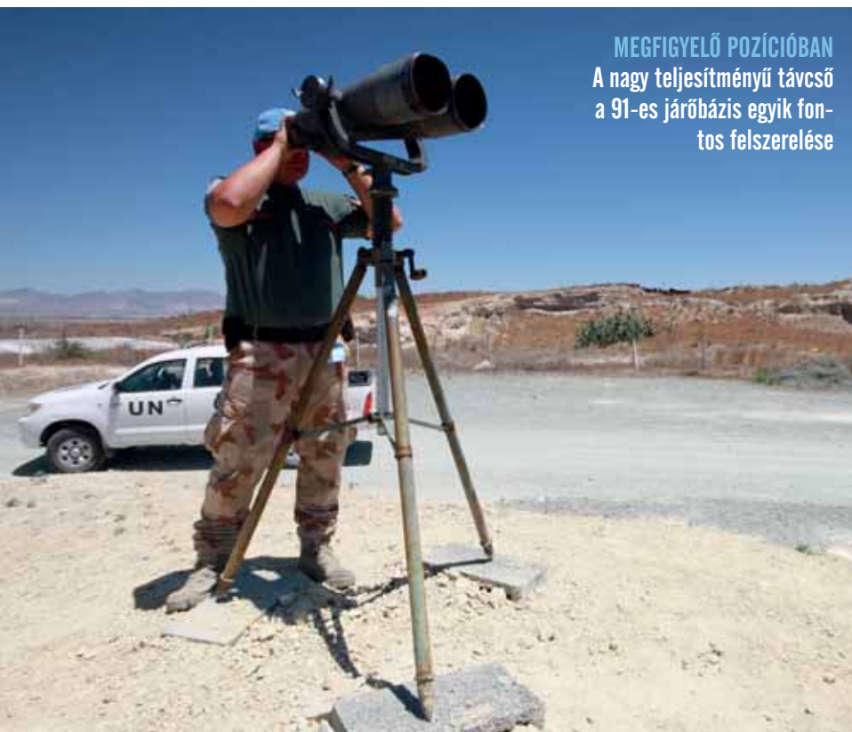
MEGFIGYELŐ POZÍCIÓBAN A nagy teljesítményű távcső a 91-es járőrbázis egyik fontos felszerelése

A magyar békefenntartók nagyobbik bázisa, mely az afganisztániakhoz képest szerény méretű, ám otthonos laktanya. A legénységen kívül itt a török és görög katonai parancsnokokkal való kapcsolattartásért felelős magyar, szerb és horvát tisztek is dolgoznak. A békefenntartók terepjárói szinte folyamatosan úton vannak