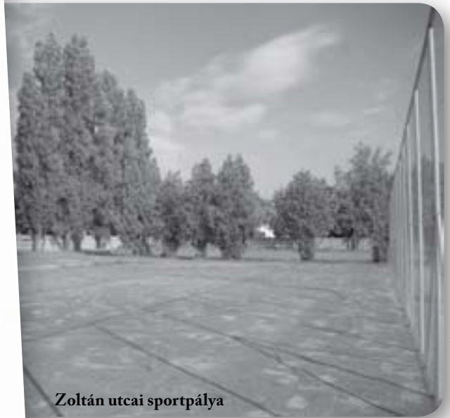
Zoltán utcai sportpálya

Miután összegyűjtöttük a véleményeket, ötleteket, javaslatokat, lakossági fórumot hívunk össze a helyhatósági választások előtt, amelyre meghívjuk a kerületi vezetőket, politikusokat, döntéshozókat. A lakosságnak lehetősége lesz meghallgatni, hogy a Wekerlével kapcsolatban milyen jövőképük van másoknak, illetve a civileknek. Elmondjuk, hogy mi mit gondolunk: mi mit szeretnénk, s miképp javítanánk a jövőben az együttműködést.