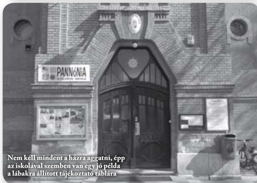
Nem kell mindent a házra aggatni, épp az iskolával szemben van egy jó példa a lábakra állított tájékoztató táblára