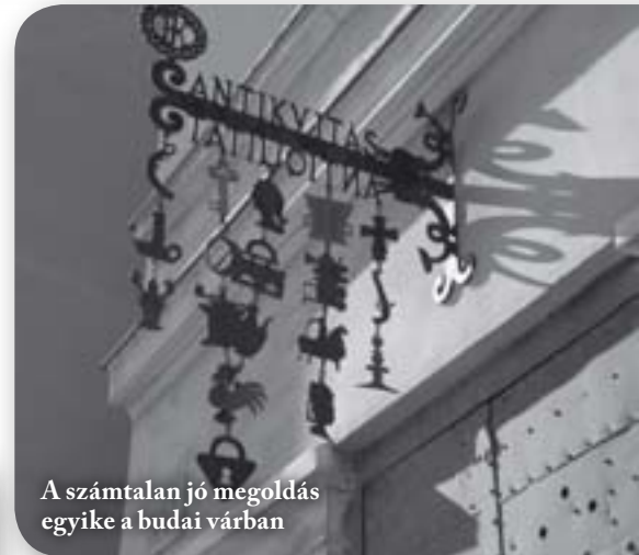
A számtalan jó megoldás egyike a budai várban

lésképi véleményezési eljárás keretén belül azonban elhelyezhető cégtábla, címtábla, cégér vagy egyedi tájékoztató tábla három éves időtartamra. Az önkormányzati gyakorlat ismerve az engedélyezési eljárás nem az ellehetlenítésről szól, csak a településképi szakmai szempontok megjelenésének lehetőségét biztosítja.