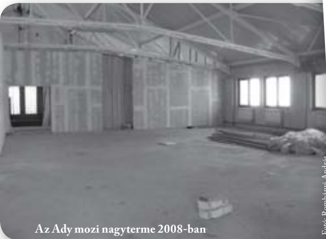
Az Ady mozi nagyterme 2008-ban