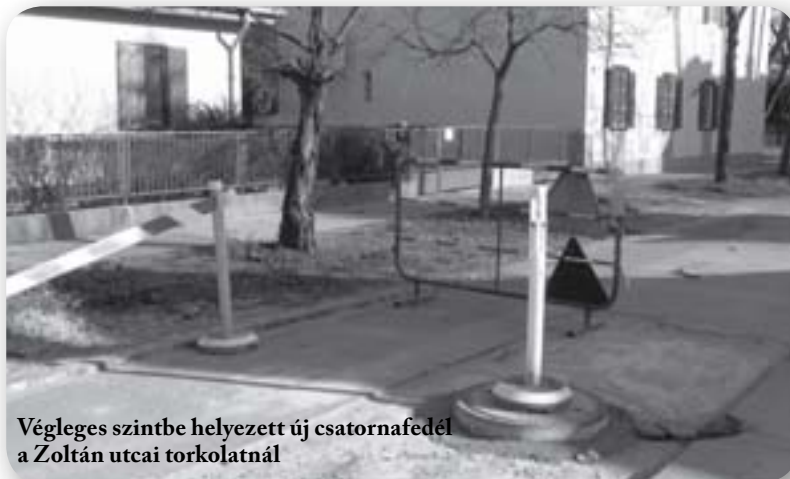
Végleges szintbe helyezett új csatornafedél a Zoltán utcai torkolatnál

Egy véglegesre kialakított tér-rekonstrukció természetesen érinti a téren áthaladó közműveket is. Mivel a megvalósítás több lépésből áll, az előrelátó gondolkodás azt követeli, hogy a szükséges közműállomány az adott területen sokáig működjön hibátlanul, tehát a tér út és kertészeti felújítása előtt célszerű a régi, leromlott állapotú közműveket cserélni, ill. felújítani, hogy később ezekkel a közművekkel ne legyen probléma. Ugyanis az öreg, elhasználódott vezetékeknek gyakran előfordulhatnak meghibásodások, melyek az elkészült tér felszínének újbóli feltúrását jelentenék. Épp ezért az önkormányzat elébe ment a felszíni munkák megkezdésének, és elkészítette a szükséges mélyépítési munkákat.