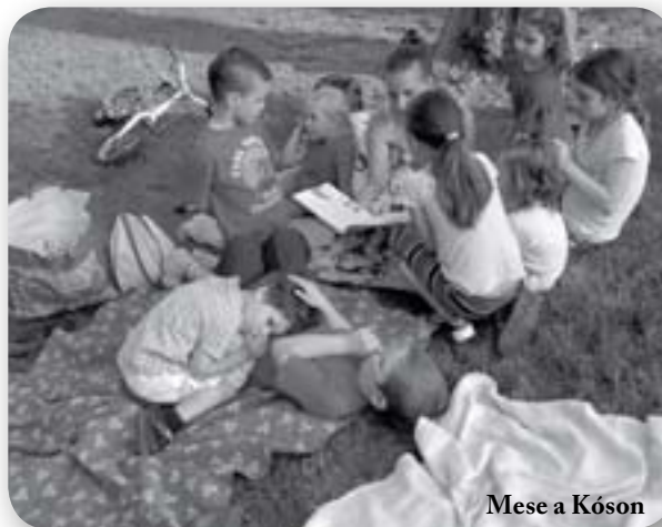
Mese a Kóson