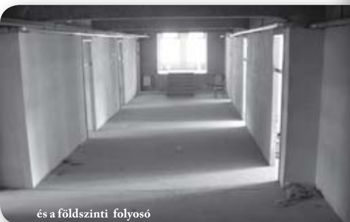
és a földszinti folyosó