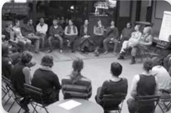
Fotó: Fekete Hajnal

A Zöld 17. egy kerületi szintű lakossági kezdeményezés Rákosmentén. Önkormányzati támogatással egy régi mozi épületben alkalmi jellegű termelői piacot szerveznek, a kertjében