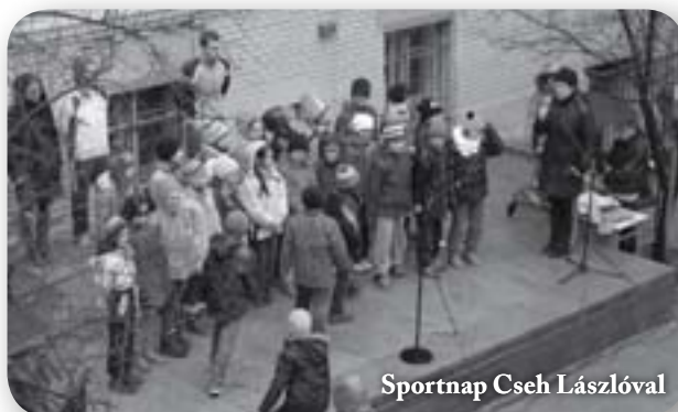
Sportnap Cseh Lászlóval