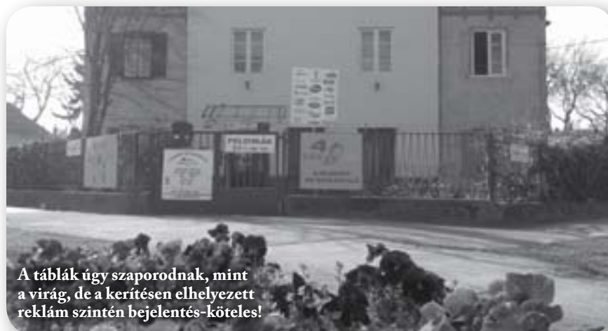
A táblák úgy szaporodnak, mint a virág, de a kerítésen elhelyezett reklám szintén bejelentés-köteles!

A helyi építési szabályzat és a vele összhangban lévő tavaly megszületett helyi reklámrendelet a Wekerletelep területén alapvetően nem teszi lehetővé új reklám- vagy hirdetőberendezés elhelyezését. Telepü-