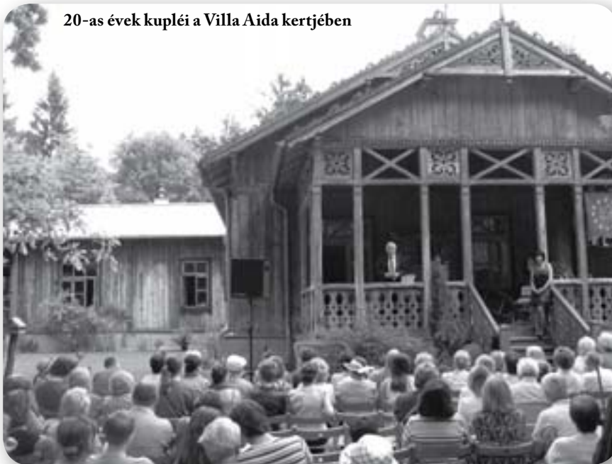
20-as évek kupléi a Villa Aida kertjében