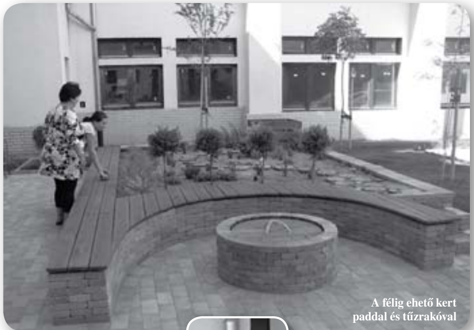
A félíg ehető kert paddal és tűzrakóval

Négy darab csempe hatású térkő van az udvar kövezetében. – Szerettünk volna olyan elemet, ami egy kicsit visszaadja Kós Károly, vagy épp a telep szellemét. Meg talán a ház szecessziós hangulatát. Ekkor találtunk rá ezekre a páva mintázatú térkövekre. Ők a szép múlt