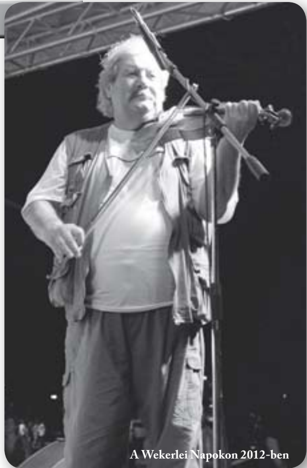
A Wekerlei Napokon 2012-ben

A telephez több szálon kötődik. Itt él leánya családjával. Nálunk a Wekerletelepen pedig két ízben lépett föl. Primási játéka könnyednek tűnt, mégis virtuóz és lenyűgöző volt. Ám a koncertek után való beszélgetések, tréfálgatások is feledhetetlenek a krónikás számára.