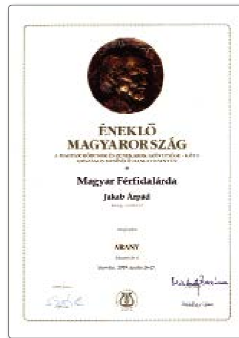
És a díj

Idén Centenáriumot ünnepel a dalárda, melynek tiszteletére emlékkönyv készül. Az ünnepi hangversenyre 2021. szeptember 11-én került sor, együtt ünnepelve a testvér- és vendégkórusainkkal.