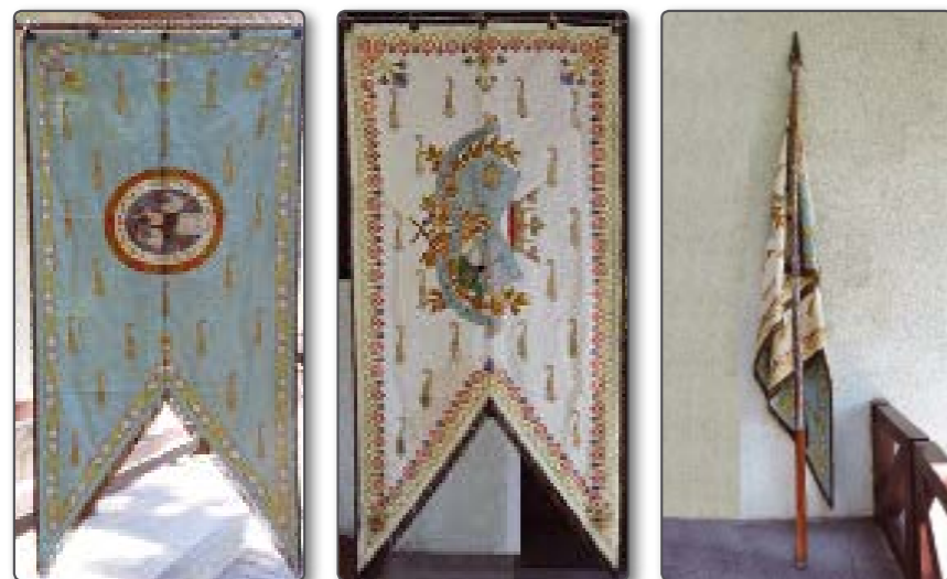
A zászló kék és fehér oldala