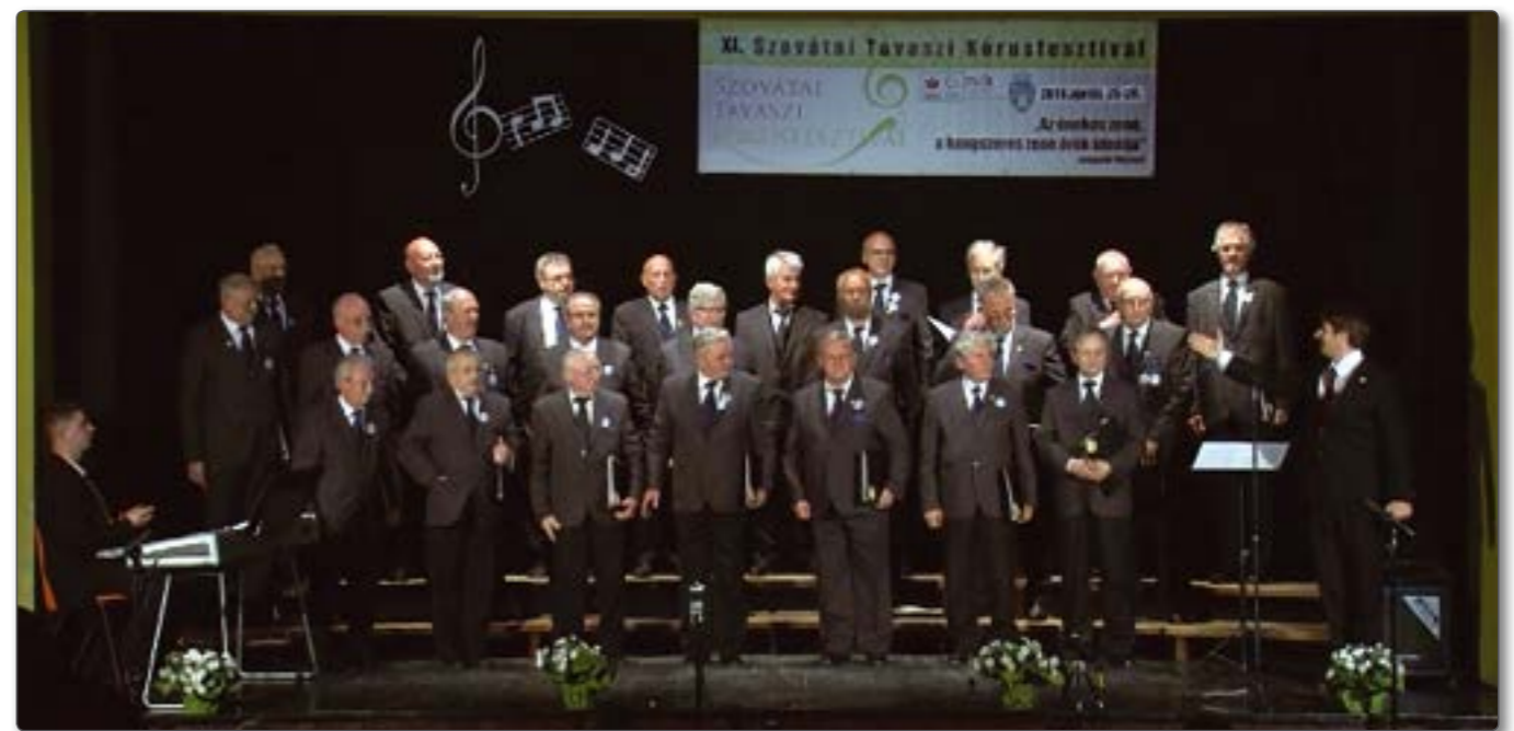
Szovata – 2019 – „Az Aranycsapat”

1989 után szerepelt a város történelmi, kultu-