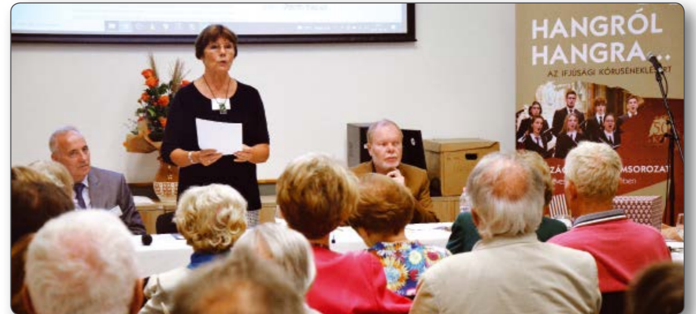
fotó: Birinyi József

A Magyar Kórusok, Zenekarok és Népzenei Együttesek Szövetsége, alapító nevén Kórusok Országos Tanácsa, a KÓTA csaknem másfél évszázados múltja visszatekintő, országos és határokon átívelő hazai művészeti és szakmai civil ernyőszerkezet. Célja az egyetemes zenekultúra, ezen belül elsősorban a kórusművészet, a népzene, az egyházzene, a műzene minden számottevő értékének feltárása, ápolása, megóvása, népszerűsítése - kiemelkedő szerepet biztosítva természetesen a magyar zenei értékeknek. Tagsága révén - közvetve és közvetlenül - mintegy 100 ezer elhivatott nem hivatásos énekest és zenészt fog össze, a legkisebb énekes csoportoktól a nagy ifjúsági és felnőtt kórusokig, egyházzenei együttesekig, a népzenei és nemzetiségi szólistáktól a zenekarokig.