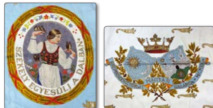
A zászló címerei