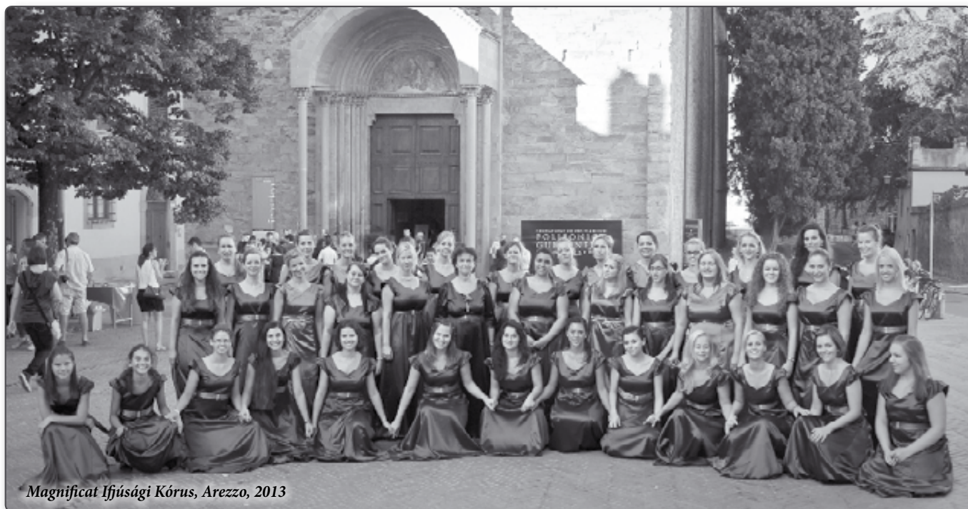
Magnificat Ifjúsági Kórus, Arezzo, 2013

Strasbourg és Elzász fontos helyet foglal el a