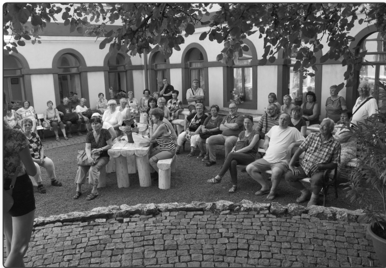
Bőjte atyánál a Dévai Gyermekotthonban

Csernátonban szálltunk meg, ahonnan a hegyeket átszelve elmentünk a Peles kastélyba, majd visszatérve Brassóban néztük meg Románia legnagyobb templomát, a gótikus Fekete templomot. A templom kis kápolnájában énekszóval köszöntük meg az érdekes bemutatót egy kedves diáklánynak. A csernátoni több mint két hektáros területen elterülő Haszmann Pál Skanzen és Múzeum megtekin-