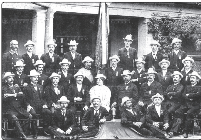
A Kecskeméti Dalárda 1903-ban

A Kecskeméti Dalárda is 1864-ben alakult. A dalárégyesület már 1865-ben bemutatkozott Pesten és ezt követően rendszeresen részt vettek az országos találkozók, ahol szinte valamennyi alkalommal ezüst serleget, vagy elismerő díszoklevelet kaptak.