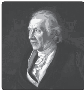
Carl Friedrich Zelter (1758-1832)