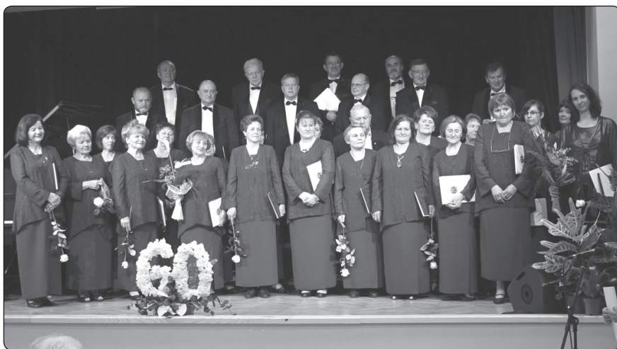
Hajdúszoboszlói Bárdos Lajos Városi és Pedagógus Énekkar