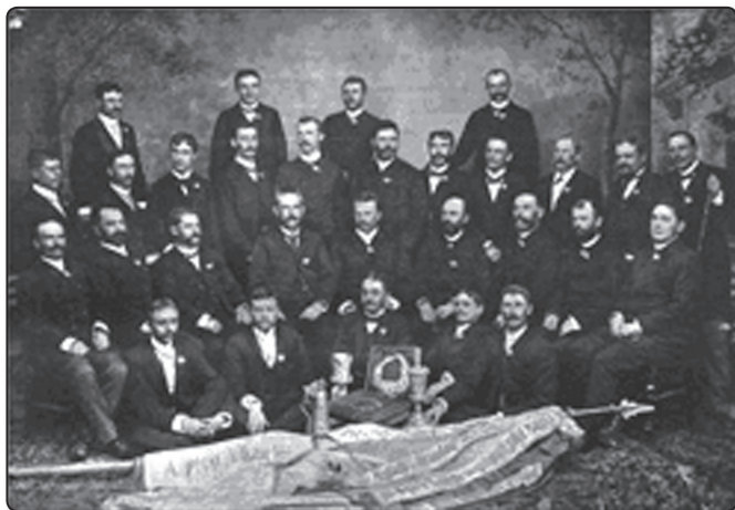
A pécsi dalárda 1891-ben

A Pécsi Dalegyletet Wachauer Károly (1829-1890) alapította 1861-ben. Wachauer zenei tanulmányai mellett orvosi tanulmányokat is folytatott Bécsben (Josephinum), majd hazatérése után először énekesként, később karmesterként működött a pécsi székesegyházban. 1861-ben megalapította a Pécsi Dalárdát, amely hamarosan az ország első kórusává vált.