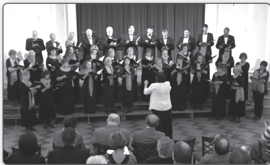
Budapesti Monteverdi Kórus