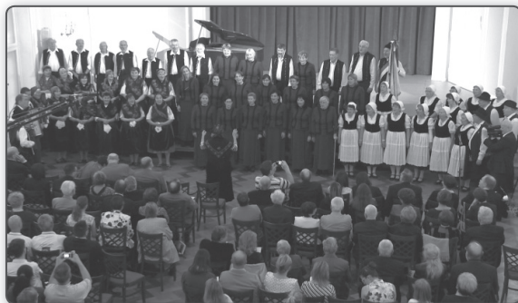
Német nemzetiségi kórusok közös fellépése

műsor összeállítói jóvoltából. Három együttesük is fellépett, először egyenként, majd közösen énekelve is. Vidám, több tangóharmonikával kísért dallamaik, népviseletbe öltözött kórustagjaik jókedvre derítették a közönséget, és ízelítőt kaphattunk a magyarországi német kultúrából, kedélyességéből is. Hallhattuk a Mondschein