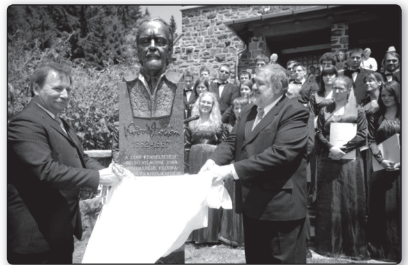
Kodály Zoltán szobrának avatása Galyatetőn

Az önkormányzati erőforrások mellett a Nemzeti Kulturális Alap köztéri szoborállítás támogatására kiírt pályázatán elnyert összegnek köszönhetően valósulhatott meg a régi terv: legyen szobra Kodály Zoltánnak Galyatetőn, ott ahol hosszú évek alatt oly sok időt töltött pihenéssel, munkával! A szobor felavatása volt a központi szervező erő, e köré épült a program többi része: az alkalomhoz méltó ünnepélyes szentmise, és annak keretében Kodály Zoltán Missa brevis című művének első galyai előadása, az Új Liszt Ferenc Ka-