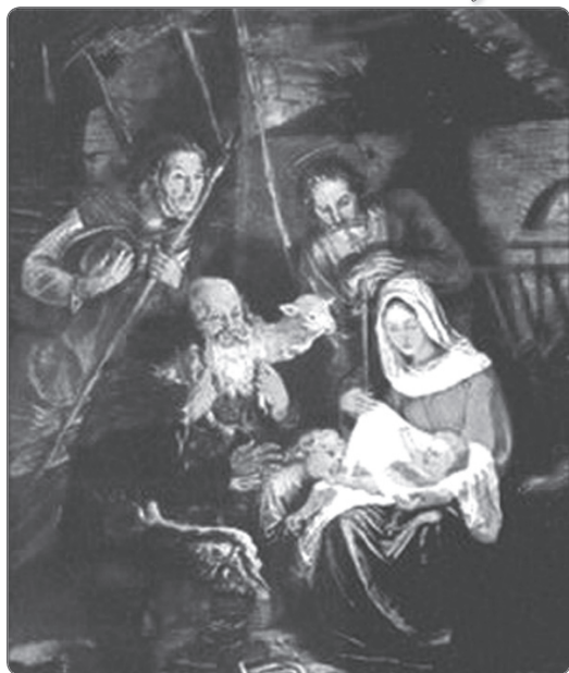
a ZeneSzó szerkesztője és a KÓTA vezetősége

Minden Kedves Olvasónknak Áldott Karácsonyt és Szedményes, Békés Új Esztendőt kívánunk szeretettel 2014 Karácsonyán!