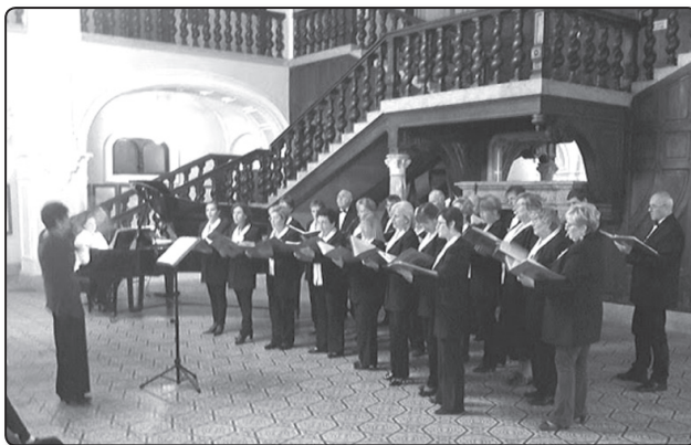
Koncert a Károlyi kastélyban

Ebéd után csatlakoztunk a nagykarolyi kórushoz, és továbbindultunk az esti koncert helyszínére. Hihetetlen élmény volt ott énekelni. A Karolyi kastély ugyanis első kirándulásunk idején még romos volt, a második ott tartózkodásunk idején már megcsodálhattuk a gyönyörűen helyreállított épületet. Most pedig ennek díszcsarnokában énekelhettünk. Ismét nagyszámú közönség hallgatott minket, és valamennyi énekesünkkel