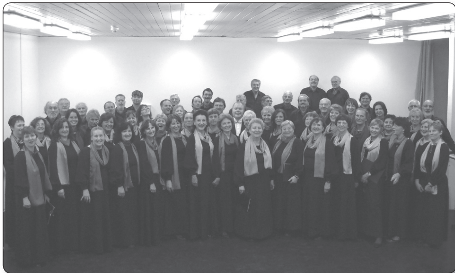
István Király Operakórus

Az Operakórus kisebb csoportja két nappal később november 9-én Gyulán, Erkel Ferenc szülővárosában a gyulai Erkel Ferenc Vegyes Karral egyesülve adta elő a Magyar