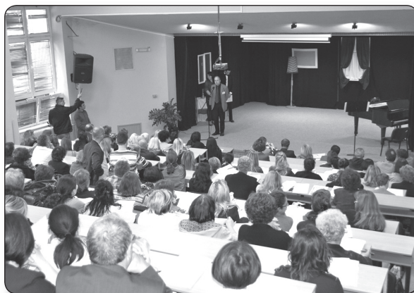
A Vajdasági Tanítóképző Főiskola konferenciája - Kikinda

segítse egészen a felnőtté válásig, sőt utána is. Ha a zene, éneklés, mozgás az ember életének részévé válik, utána már nem tud ezek nélkül a dolgok nélkül élni. Elgondolkodtató az a tény is, hogy régen nem volt szükség fejlesztőpedagógusra és nem volt ennyi magatartászavaros és hiperaktív gyerek. Soha nem volt még ennyire szükség a zene által és segítségével való képességfejlesztésére. Mégpedig minél fiatalabb korban. Ez lehetőleg a gyermekek 3-7 éves korig terjedő életszakaszában történjen. Utána sem felesleges és elvetendő, de ezek az évek már nem hozhatók vissza, mint ahogy erre a Psalmus Humanus program is na-