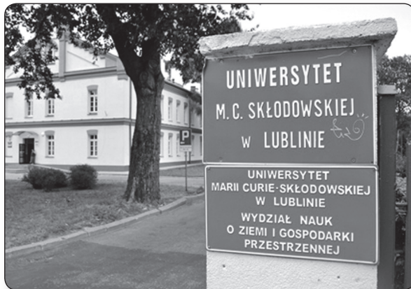
A Lublini Művészeti Egyetem

tala megalkotott módszer. (...) Úgy gondolom, hogy nem azt kellene magyarázni, hogy miért van szükség a Kodály módszerre, hanem jogosan tehetjük fel azt a kérdést, hogy miért nem részesülhet ebben a csodálatos és komplex nevelési módszerben minden gyermek. Hiszen ez a módszer lehetőséget nyújt a kisgyermekkoról kezdve a képességfejlesztésre, ráadásul oly módon, hogy ez a gyermek életének részévé válva észrevétlenül