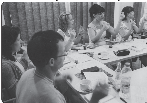
Továbbképzés a Génoművelés Program keretében

A Tehetséggondozás Kodály szellemében elnevezésű képzési programot a Psalmus Humanus Művészetpedagógia Egyesület tagjai dolgozták ki, akik valamennyien magas szakmai felkészültséggel, zömében több diplomával