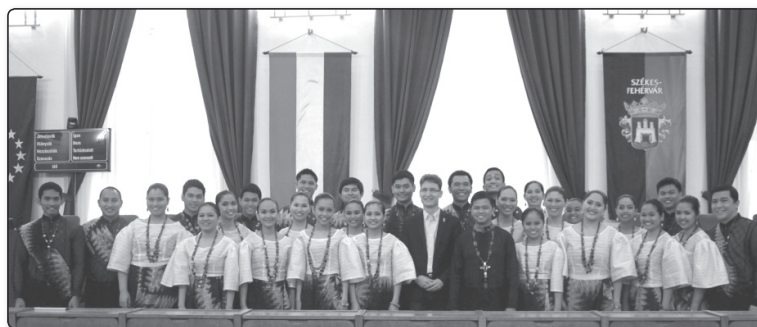
A Fülöp-szigeti Manila Koncertkórus