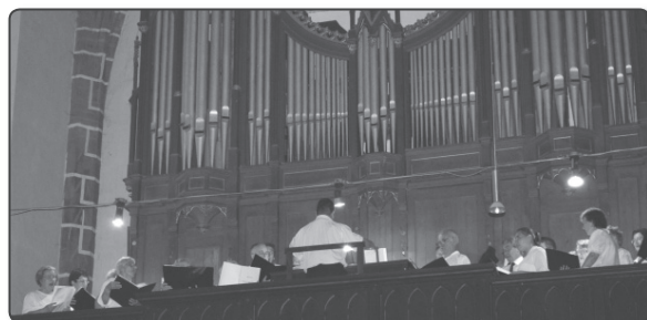
A Keszthelyi Salve Regina Kórus