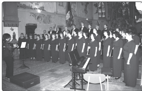
A Pesterzsébeti Városi Vegyeskar