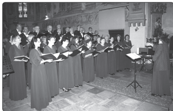
A Keszthelyi Helikon Kórus