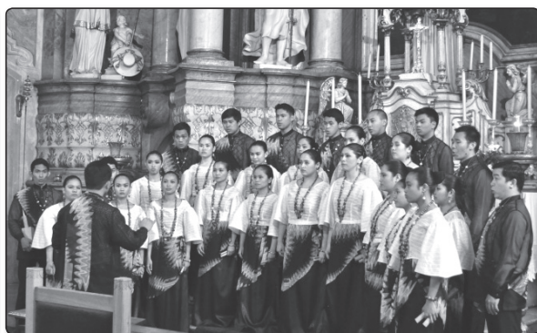
Fülöp-szigeti kórus hangversenye