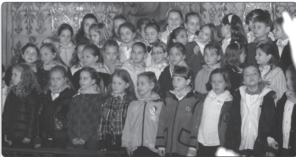
Kodály Iskola Legkisebbek Kórusa