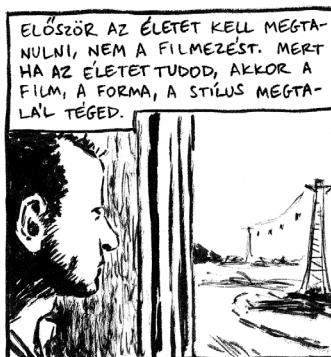
KONCEPCIÓ: HUDRA MÓNI • RAJZ: ORAVECZ GERGŐ