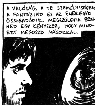
Szöveg: Tarr Béla – interjú (HVG, 2013 február)