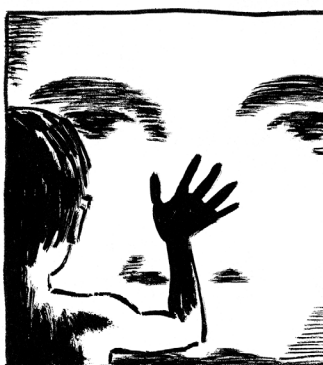
KONCEPCIÓ: HUDRA MÓNI • RAJZ: ORAVECZ GERGŐ