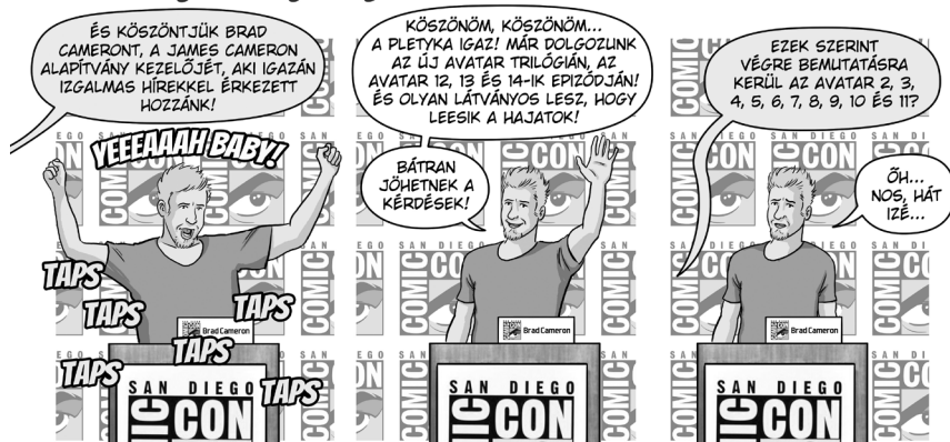
PILCZ ROLAND, 2020.