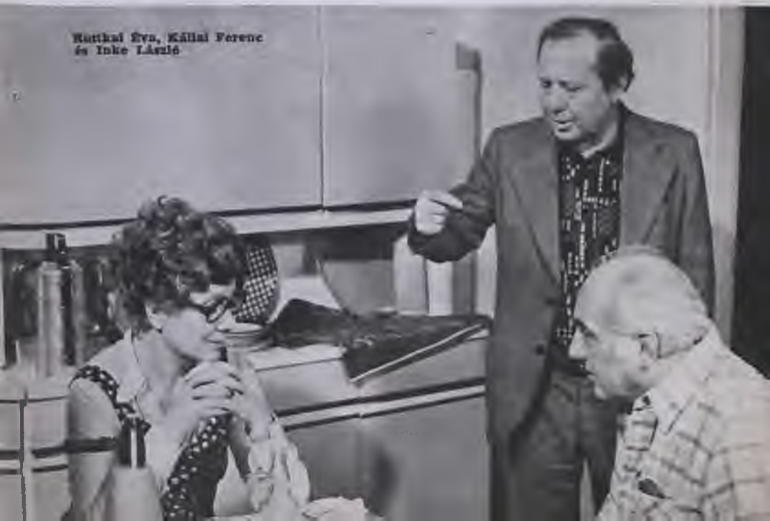
Ruttkai Éva, Kállai Ferenc és Inke László