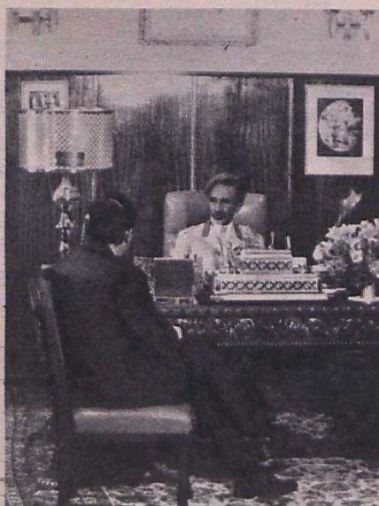
Interjú I. Hailé Szelasszié etióp császárral

szubjektív forma és az objektív tartalom olyan egységben jelentkezne; a történelem-politikai helyzet sajátossága annyira a megszólaltatott tanúságtévők jellemé- nélt, emberi arculatának tipikumán keresztül nyilvánulna meg, mint az ő riportjaiban.