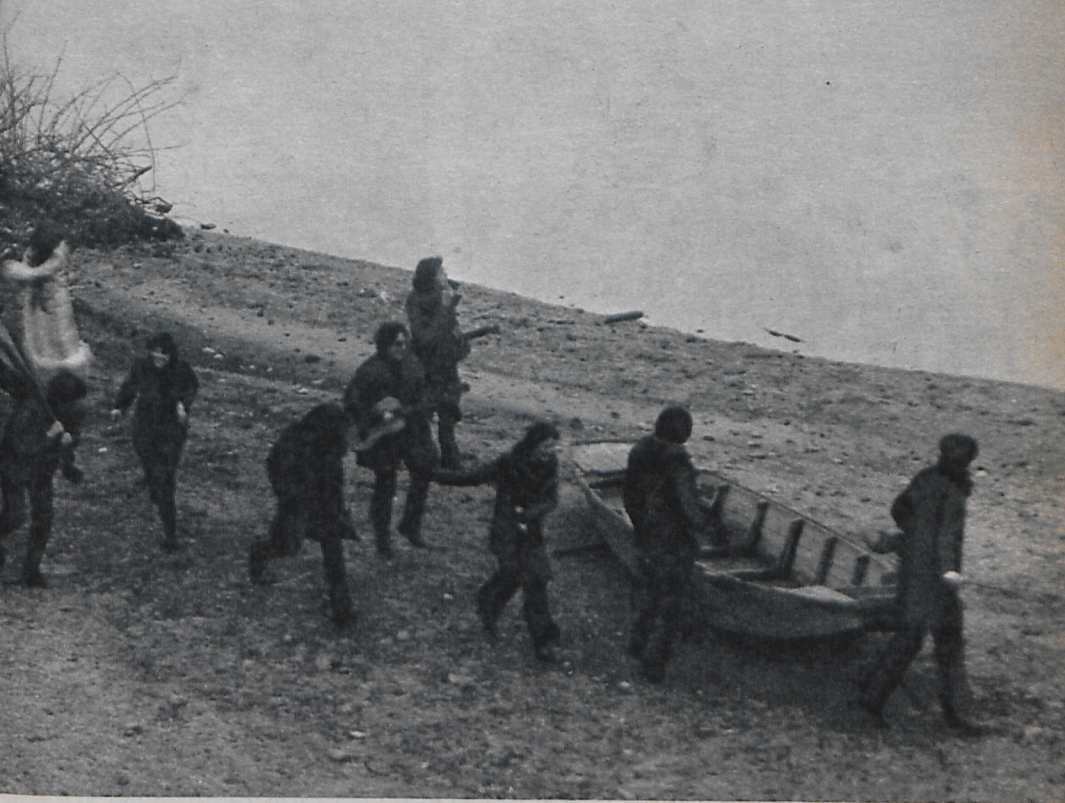
Jelenet a filmből

igazi jelentésüket, érzelmi, esztétikai tartalmukat csak a képek mögötti, jelképekben bujkáló dráma átélésével tudjuk megérteni. Különösen az út utolsó stációjára vonatkozik ez, a film második felére.