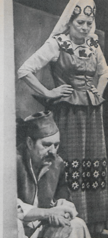
Jelenetek A tűz balladája című tévé-filmből. Írta Gáll József, rendező Paulo Lajos (Komáromi Gábor felvételei)