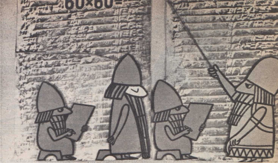
Macskássy—Várnai: 1, 2, 3...

a „festői-költői” törekvéseket kell megkülönböztetnünk. (A bábfilmek e szempontból is más kategóriába tartoznak, s dolgaikra ilyenformán csak később keríthetünk sort.)