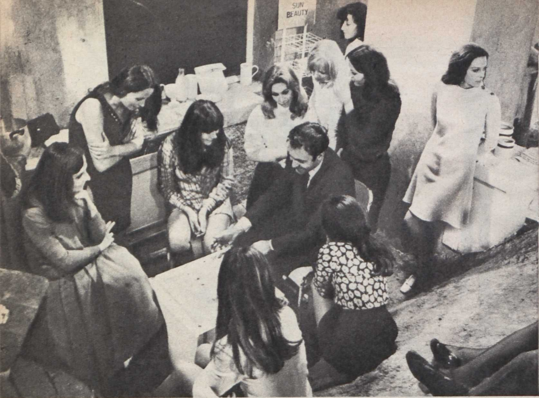
Jelenet az olasz Francesco Maselli: Nyílt levél egy esti újsághoz című filmjéből

lenség is volna, harmincöt film fut naponta, van, hogy több), igencsak sokszínű képet kaphatna ennek a művészetnek a mai állásáról.