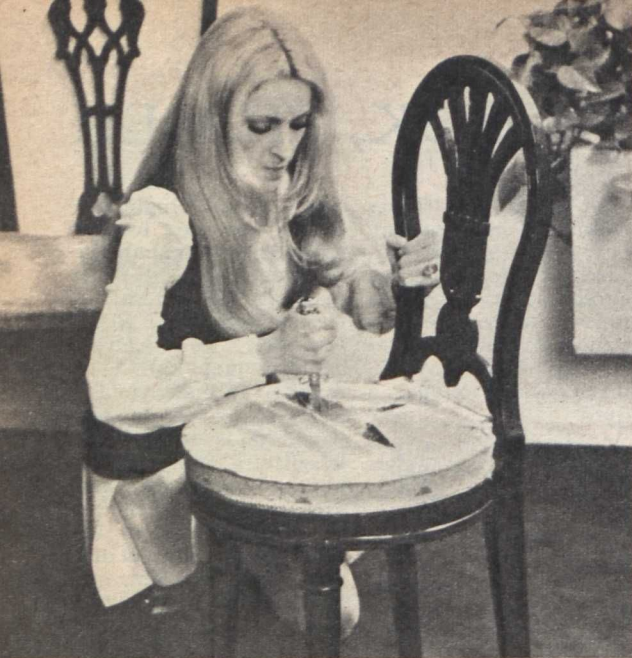
Az olasz Mauro Bolognini: Metello című filmjének egyik jelenete

sokan mások. (Ha az utóbbiak közül valaki mégsem jelent meg, és itt mégis szerepel — annak oka, hogy érkezésüket lapzárta utánra várják.)