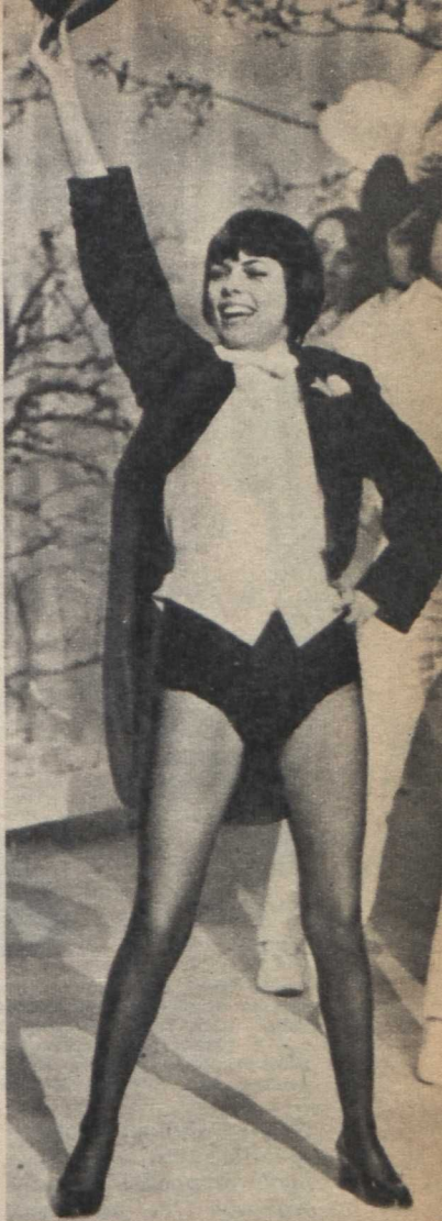
Mireille Mathieu — Marlene Dietrich régi, híres kosztümjében lép fel a Henri Salvador rendezésében készülő tévé-show-ban.

Rada Rassimov — Marco Ferreri: Az ember ivadéka című filmjének főszerepében vált ismertté. Rada Rassimov most az ismert fiatal brazil rendező, Glauber Rocha Kongóban forgatott filmjében szerepel, amelynek címe: A hétfejű oroszlán. Partnerel: Gabriele Tinti, Giulio Brogi és Jean-Pierre Léaud.