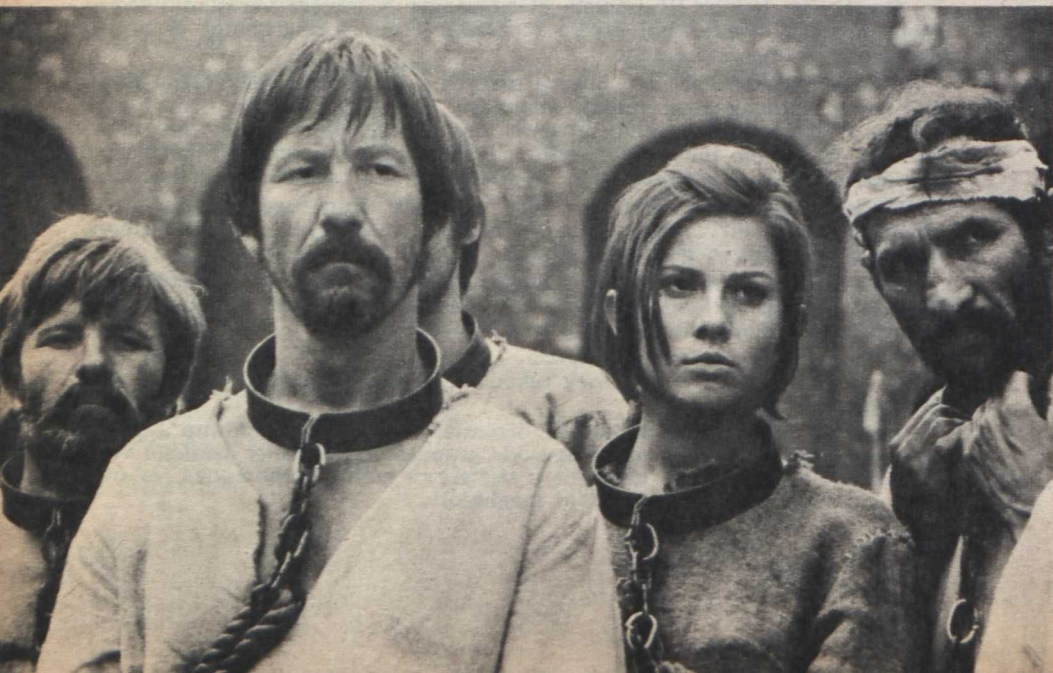
Jelenet a filmből

— A forgatás közben különös dolgot értettem meg: nemcsak az alkotók formálják a filmet, hanem a film is alakítja az alkotókat. Ez a film rendhagyó módon készült el. A vállalkozás feltételeinek megteremtése legalább annyi munkát igényelt, mint maga a film elkészítése. Hadd szóljak ezért néhány szót a vállalkozásról is. Kezdetben úgy volt, hogy csak magyar film, a 3-as Stúdió produkciója lesz az Ítélet , később a szlovák és a román filmgyártás is bekapcsolódott a munkába, s a három országot képviselő alkotócsoport kísérletet tett arra, hogy együtt, közösen gondolkozzék a történelem, a forradalom bizonyos kérdéseiről. Később, amikor ezek a gondolatok a minden-