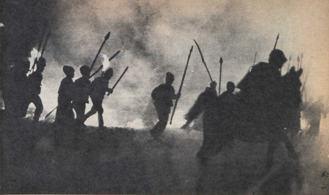
Jelenet a filmből

ban egykori ösztönös cselekvéseit, s ezáltal személyében az ösztönös lázadástól a tudatosság felé törekvő forradalmár alakja fogalmazódik meg.