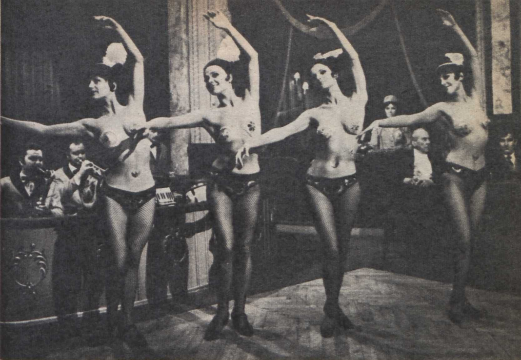
Jelenet az Olimpiai fáklya című filmből

epizódja a megszállt főváros életét mutatja be s a lengyel hazafiak legendás küzdelmének állít emléket (ez az epizód a legsikerültebb; a folytatás — Antonioni-modorban megörökített novella, és egy napjainkban játszódó komédia, egy élelmes szélhámosról, aki nyugati turistáknak eladja a nevezetes varsói műemlék Zygmunt kardját — meglehetősen érdektelen).