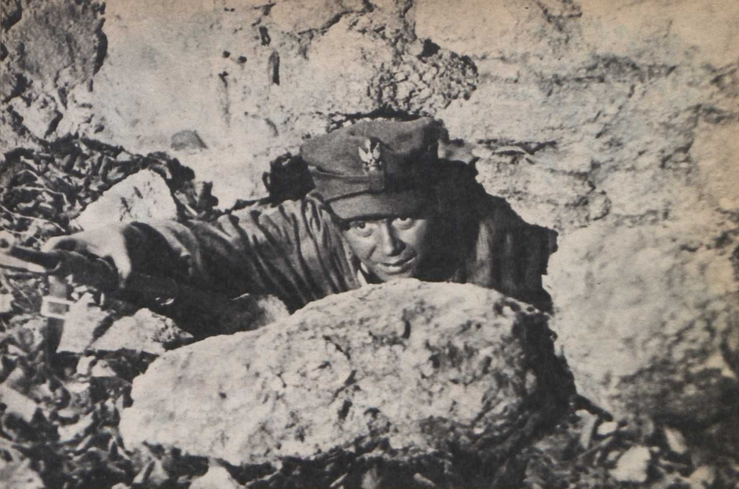
Jerzy Passendorfer: A megtisztulás napja című filmjének egyik jelenete

vonják a figyelmét attól, amit csinál. Mint filmötlet ha eredetinek nem is mondható, tartalmaz annyi badar groteszket, hogy kitelne belőle egy vígjáték, ha Ziarnik győzné további ötletekkel. A rendező korábban fél-órás dokumentumfilmben is feldolgozta ezt a témát; azt mondják, hitelesebben és eredményesebben. Az Új munkaerő egyik epizódszerepét a tavaly elhunyt Bogumil Kobiela alakítja: a színész — a tragikus sorsú Munk—Cybulski generáció tagja — egyetlen volt, aki kitűnően eltalálta itt is a groteszk játékstílust. Annak idején a Kancsal szerencsés -ben láthattuk groteszkbe hajló alakítását.