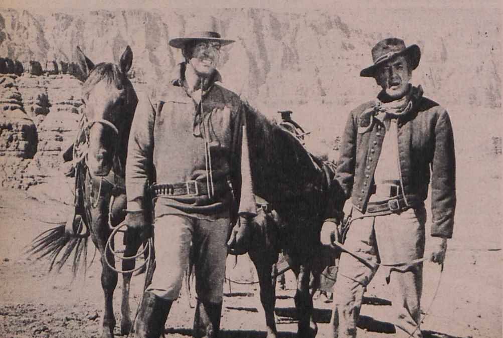
Jelenet McLaglen Bandolero című filmjéből. (Dean Martin és James Stewart)

díszletek és egy cirkuszgocsi, sok ló, coltok, sombreroék jelezték, hogy helyben vagyunk. A színészek nem akárcsak, a cirkusztulajdonos Vincent Price, akinek — mint később mondta — ez a „ More dead than alive ” (Több halott, mint eleven) éppen kilencvenedik filmje. A másik főszereplő a tagbaszakadt „új Garry Cooper”,