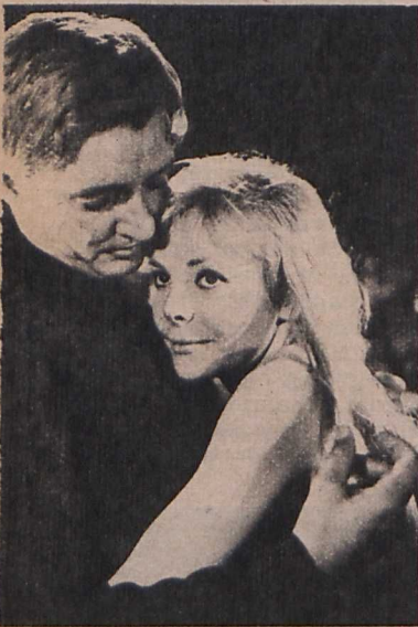
Oskar Werner és Barbara Ferris a Közjáték főszereplői. Rendező: Kevin Billington

sem tudta a nevét. Eleinte a „Schwab Drugstore”-ba jártak, amelynek az volt a jogos híre, hogy az itteni kiszolgálólánykák közül, de a vendégek közül is sokakat fölfedeztek a „vilá-