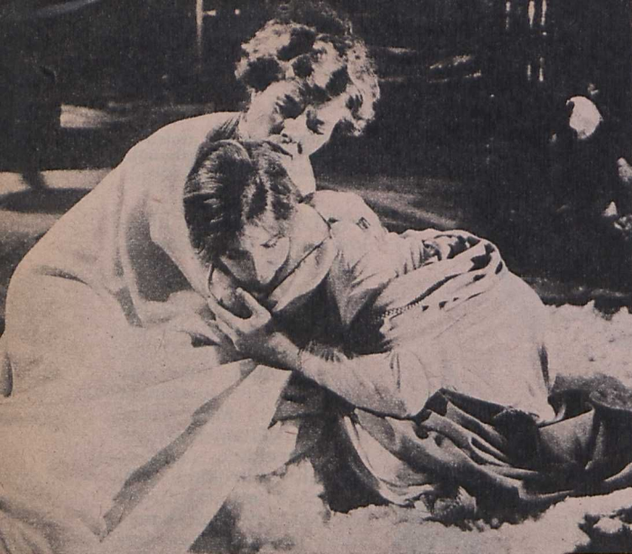
Katharine Hepburn és Jane Merrow — az Oroszlán a téiben című filmben. Rendező: Anthony Harvey