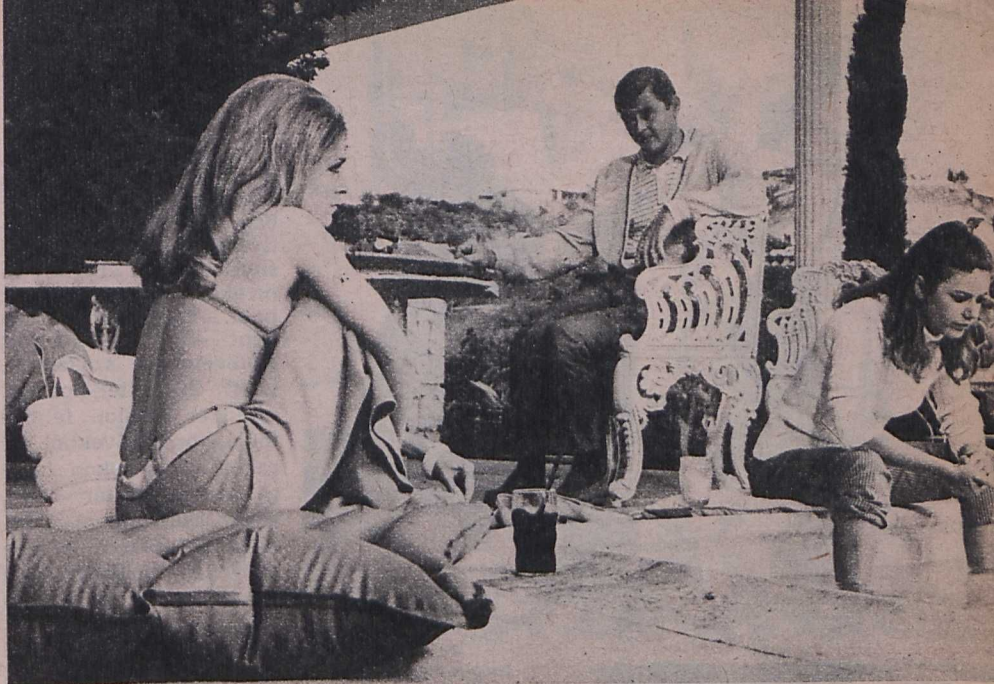
Mark Robson: A babák völgye

Ebéd közben, és a forgatás szünetében beszélgettem a művészekkel, s a producerrel is. Ez utóbbinak nem jegyeztem fel a nevét, de rögtön filmre léphetett volna önmaga típusaként. Foghegyről beszélt, gumit rágott, és tudatlan volt. A művészek kedvesek — a magyar filmről nem tudnak semmit. A fiatal író, Schenck igen. Nagy véleménnyel van arról az egyről, amelyet látott (Az apa). És kíváncsi a többire.