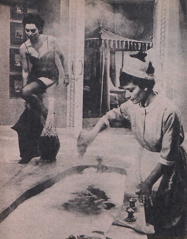
Jelenet Az én utolsó hercegnőm című filmből. Rendező: Ken Hughs

A Los Angeles-i utcákon amúgy is nehéz megkülönböztetni a hatnyolc méteres (átlag tíz méter magasan elhelyezett) tábla-hirdetések erdejében, hogy most tulajdonképpen hová invitálják, mire ösztönzik az embert. Mozi-csalogatóknak véltem nem egy sztár-képekkel, girlandokkal, tükrökkel stb. feltűnővé tett ital-hirdetést, sőt, egy sajátos másikat is. Ez utóbbi barátságos zöld domboldalt ábrázol, a Bandolero című western plakátja és egy Coca Cola hirdetés között, körülbelül nyolc méter széles, hat magas, és arra a közismert tényre figyelmeztet, hogy meg is kell halni. Ha már így van —