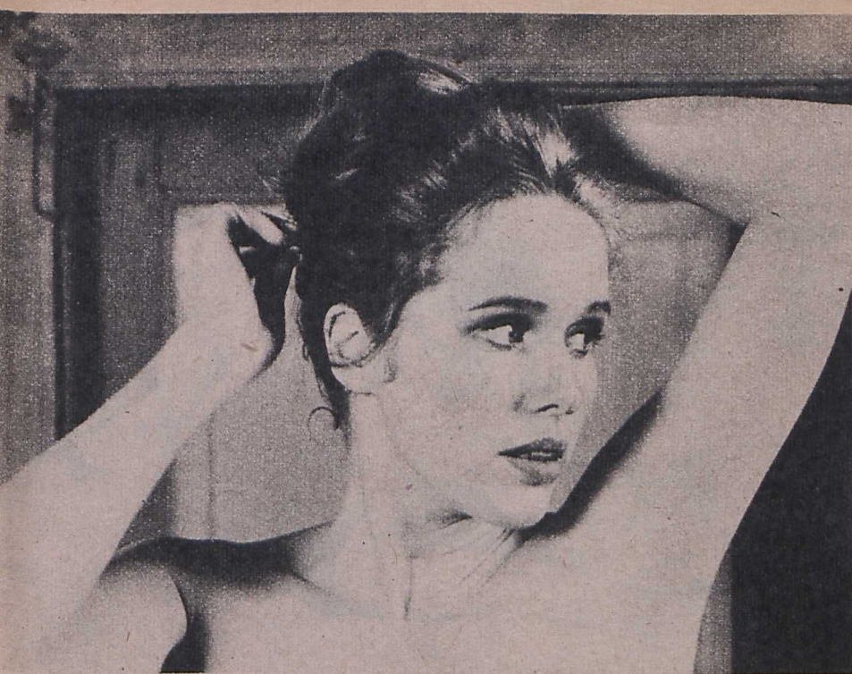
Liv Ullmann — Ingmar Bergman Szégyen című alkotásában

hogy a lélek gyötrelmeit és kalandjait nem a világ eseményeitől elszigetelten, hanem bizonyos égető aktualitások összefüggésében boncolja. A Szégyen főszereplői harci események forgatagába kerülnek, erőszak, agresszió, háború áldozatai. S, mint maga Bergman mondta, filmjében azt akarta kendetlenül bemutatni, hogy a megalázás, és az emberi méltóság megsemmisítése, miképpen irtja ki az emberséget az áldozatból. A Szégyent egyébként még ebben az esztendőben követi a harmadik mű. Színhelye ugyancsak Farór szigete. Mindhárom alkotás női főszereplője Liv Ullmann, partnere Max von Sydow.