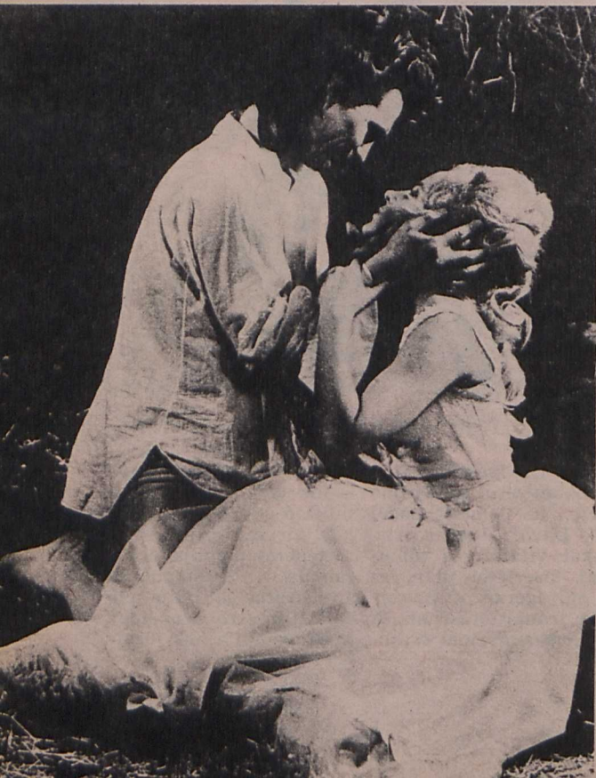
Jelenet Vilgot Sjöman: Nővérem, szerelmem című filmjéből

Vilgot Sjöman, Bergman legkedvesebb és legmerészebb tanítványa ismét igen kényes témához nyúlt. Nővérem, szerelmem című új művében múlt századi környezetbe helyezve a testvérek közötti szerelem drámai viszontagságai-val foglalkozik.