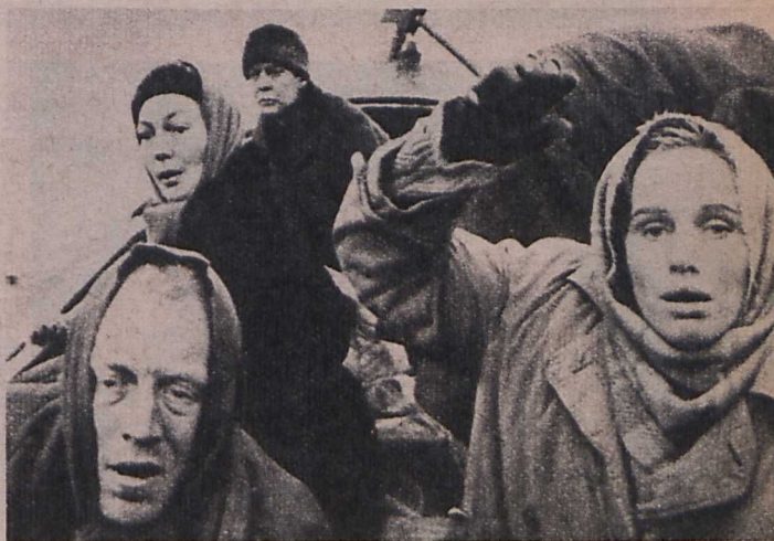
Max von Sydow és Liv Ullmann a Szégyen-ben

Elkészült Mai Zetterling új filmje, a Flic-