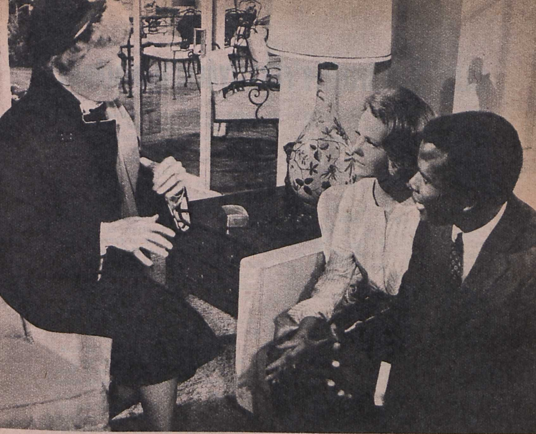
Katherine Hepburn, Katherine Houghton és Sidney Poitier — Stanley Kramer filmjében

végeredményben a fajgyűlölet elleni harcot gyengíti.