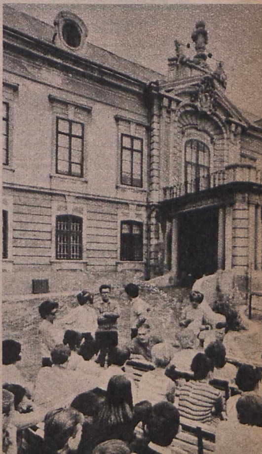
Megbeszélés a fiatalokkal, a leendő „népi kollégistákkal”