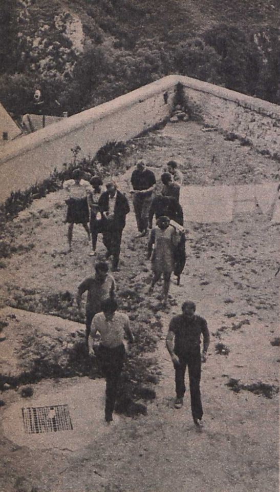
Motívumkeresésen a stáb vezérkara Veszprémben