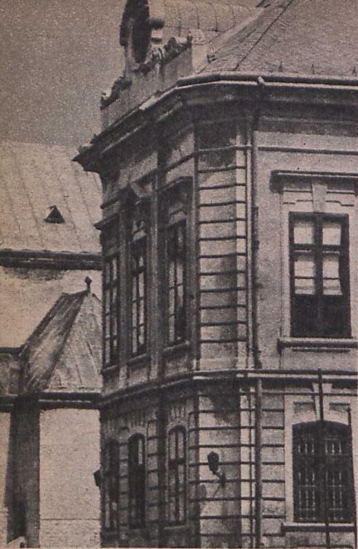
Motivumfotó a filmhez (Fejes László felvételei)