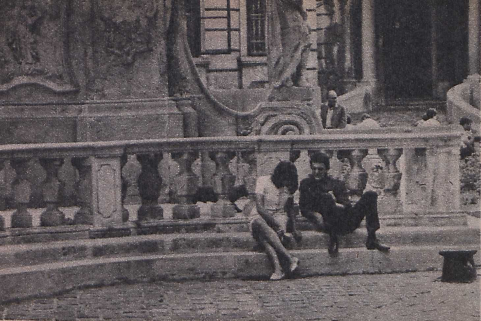
Motívumfotó a Fényes szelek című filmhez

zünk mindarról, ami a múltunkban „nem szép” volt. Legjobb példája ennek a kiegyezés korának utólagos idealizálása volt. Akkor a hivatalos közvélemény a maga teljes apparátusával is ezt a „feledést” szolgálta. Ma a hivatalos közvélemény mélységesen megtagadja a Horthy-rendszer egészét, fiaink számára azonban mindez már csak írott történelem, nem élő valóság. Szerintem ezért is érdekes és szükséges plasztikusan megmutatni, milyen volt a valóságban mindaz, amiről némely rokonszenves nagymamák és nagyapák gyöngülő emlékezete egészen más meséket őriz.