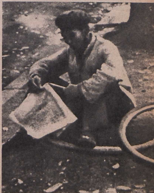
Légiriadó után Hanoi-ban

A Távol Vietnamtól vetítését mindenütt nagy érdeklődés előzi meg. Nemcsak filmtörténetileg kiemelkedő a kezdeményezés, hanem mint művészi tett is példamutató.