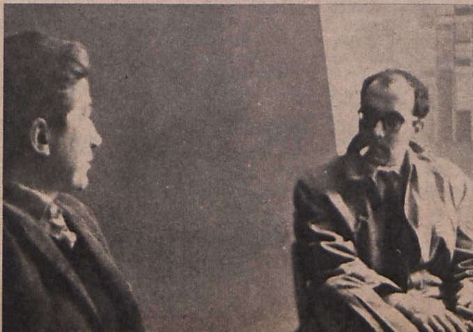
Alain Resnais és Jean-Luc Godard megbeszélnek a film-tervet