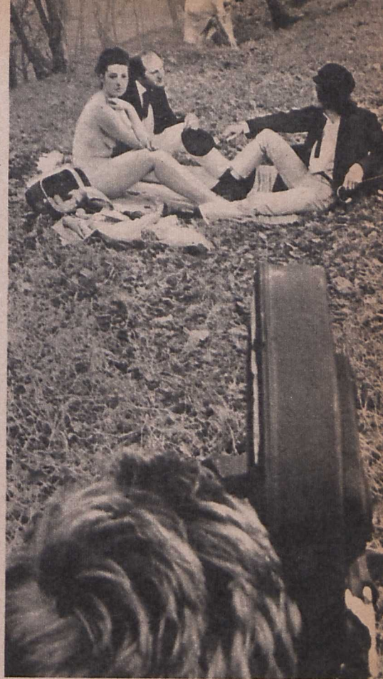
Lindsay Anderson: A fehér busz (Anglia)

Külön kell néhány szót szólnunk a magyar főiskolások sikeréről, akik alkotásaikkal a fesztivál-zsüri egyik nagydíját nyerték el. Legfiatalabb filmeseink munkáinak frissesége, rokonszenves szemléletük, önróniájuk, ahogyan saját világukat látják és ábrázolják, üdítő fuvallatként hatott a fesztivál túlfútótt légkörében.