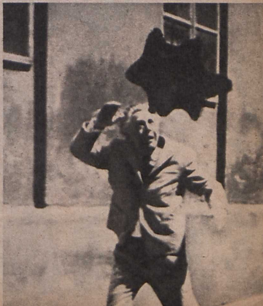
Dusan Vukotić: A folt (Jugoszlávia)

Az idei, a XIV. fesztivál is szenvedélyes viták, tiltakozások, izgatott gyűlések jegyében zajlott le. De ezúttal az a különleges helyzet állt elő, hogy az izgalmat nem annyira a bemutatott, mint a le nem vetített filmek okozták. Ezúttal nem a kormányral, nem a hivatalos Németországgal került szembe a fesztivál vezetősége, hanem a legújabb filmes korosztály lázadó csoportjával: a hamburgiakkal. Az úgynevezett Másik mozi — az amerikai Földalatti filmesekhez hasonló — ifjú, hosszú hajú profétáival. A fiatal, agresszív filmesek támadása Oberhausen ellen egy szélsőségesen avantgardista csoport anarchikus, nagy hangú, feltűnni vágyó mozgalmának látszatát keltette. Kezdetben a fesztivál vezetősége is lebecsülte jelentőségüket. De a botrányos esemé-